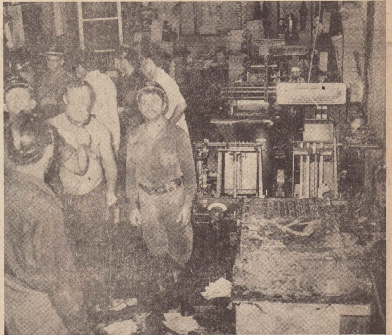
Os «soldados do fogo» chegaram a tempo de evitar um sinistro de maiores consequências.