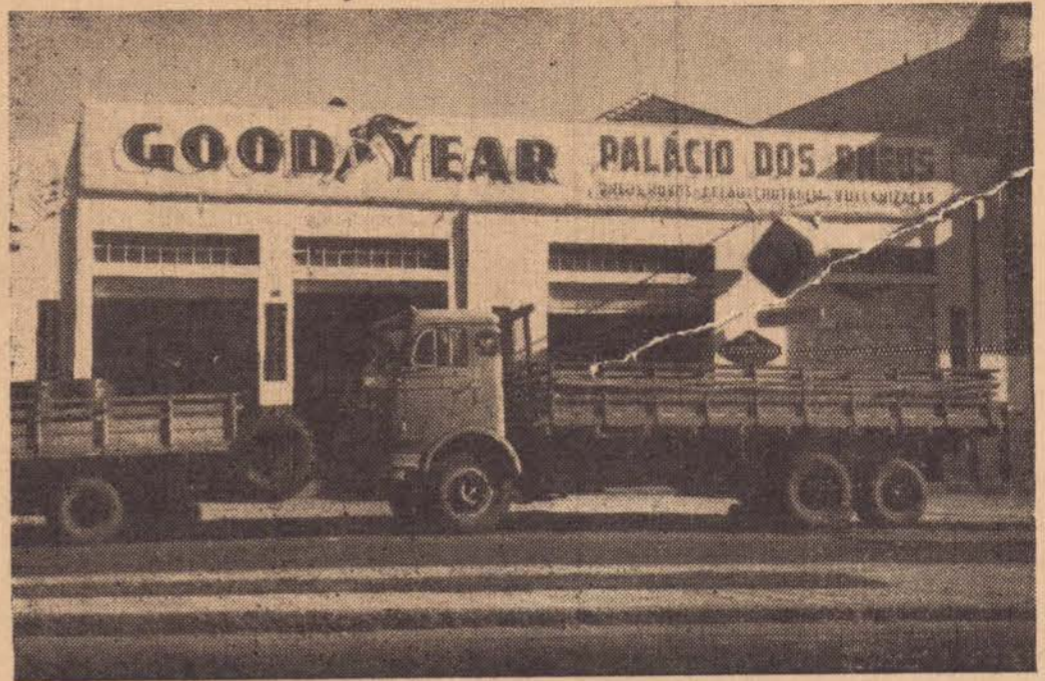
FARIS. GOOD YEAR

Cumprimentamos os nossos prezados amigos e fregueses, desejando-lhes Boas Festas e um prospero Ano Novo de venturas e felicidades.