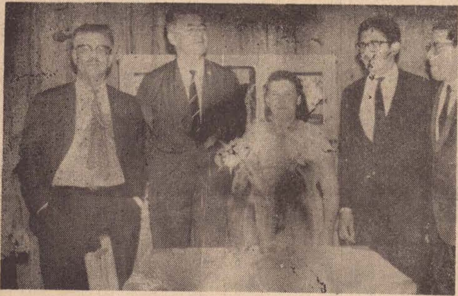
O ministro, o interventor da IBRA, o prefeito de Estrêla do Norte e o Administrador da Rebojo visitando a casa de um dos parcelheiros.