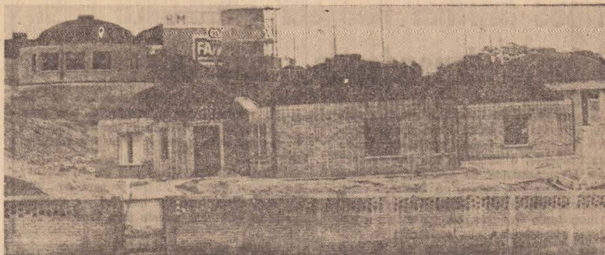
Homenagem a esposa do ex-governador: a creche será denominada "Lila Bayngton Martins"