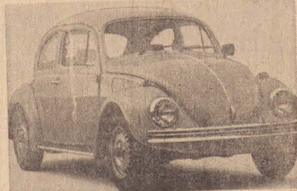
A decisão é sua e a oportunidade é agora. Com a opção do financiamento pela FINANVOLKS.

Financiamento pela Finanvolks. Revendedor Autorizado