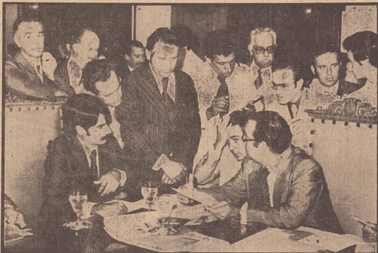
Momento da audiência do prefeito com o governador, presentes o ex-prefeito, o vice-prefeito e o presidente da Câmara.

homologar suas demissões e o presidente do sindicato estava preocupado — "A minha preocupação é que as empresas não estejam admitindo ninguém e dentro de pouco tempo nós poderemos ter aí um problema sério com relação ao desemprego".