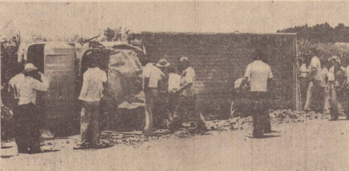
O caminhão capotou e ficou virado de lado.

Se o serviço for de primeira categoria com velório, custará CR$ 600.00 e se for de segunda, CR$ 500.00. Urnas envernizadas podem variar desde CR$600 até CR$ 1.500.00, num serviço completo e de primeira classe. Mas quem preferir algo mais luxuoso terá que dispor de uma quantia consideravelmente alta para um velório e sepultamento completo.