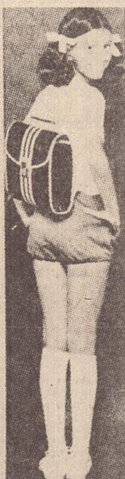
Mochila escolar Kelson's, várias cores. A partir de 78,