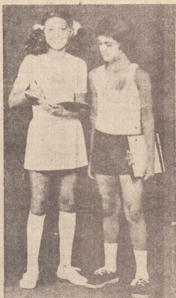
Camiseta em malha de algodão canelada, 6 a 16 anos. 29,