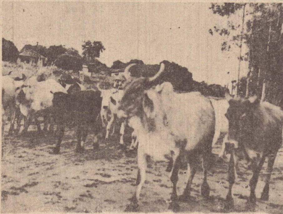
(PAGINA 3) Preços da Cobal para o boi gordo não satisfazem o produtor, nem o frigorífico e menos ainda o consumidor

Os pecuaristas da região de Presidente Prudente, consideram que o preço ideal para a venda de bois gordos deveria ser em torno de 180 cruzeiros por arroba, livre de qualquer despesa. Os diretores de frigoríficos estão efetuando compras em torno de 170 a 175 cruzeiros, deduzindo o Funrural, considerando que deveria haver melhor apreciação em torno do assunto, conciliando os interesses dos invernistas, abatedores e consumidores.