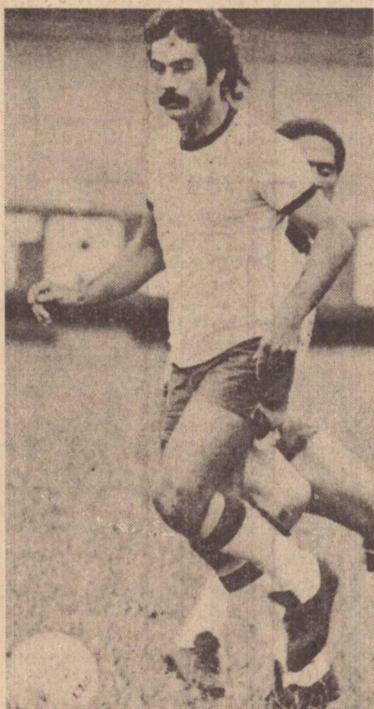
Rivelino é figura obrigatória na seleção brasileira.