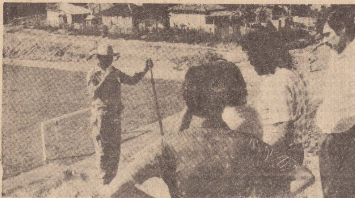
O prefeito acompanha com interesse o andamento de diversas obras.