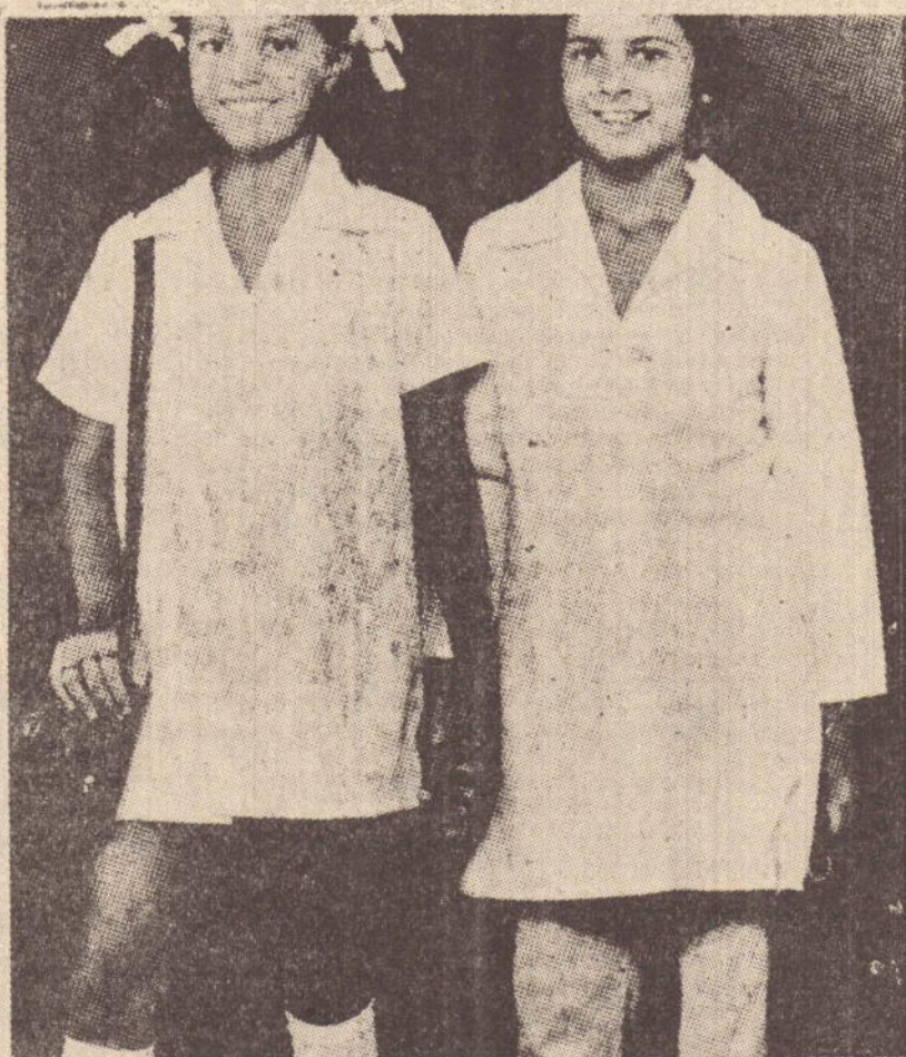
Avental unissex em tergal, manga longa e manga curta. Modelo oficial, 6 a 18 anos. 65,