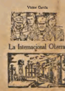
La Internacional Obrera