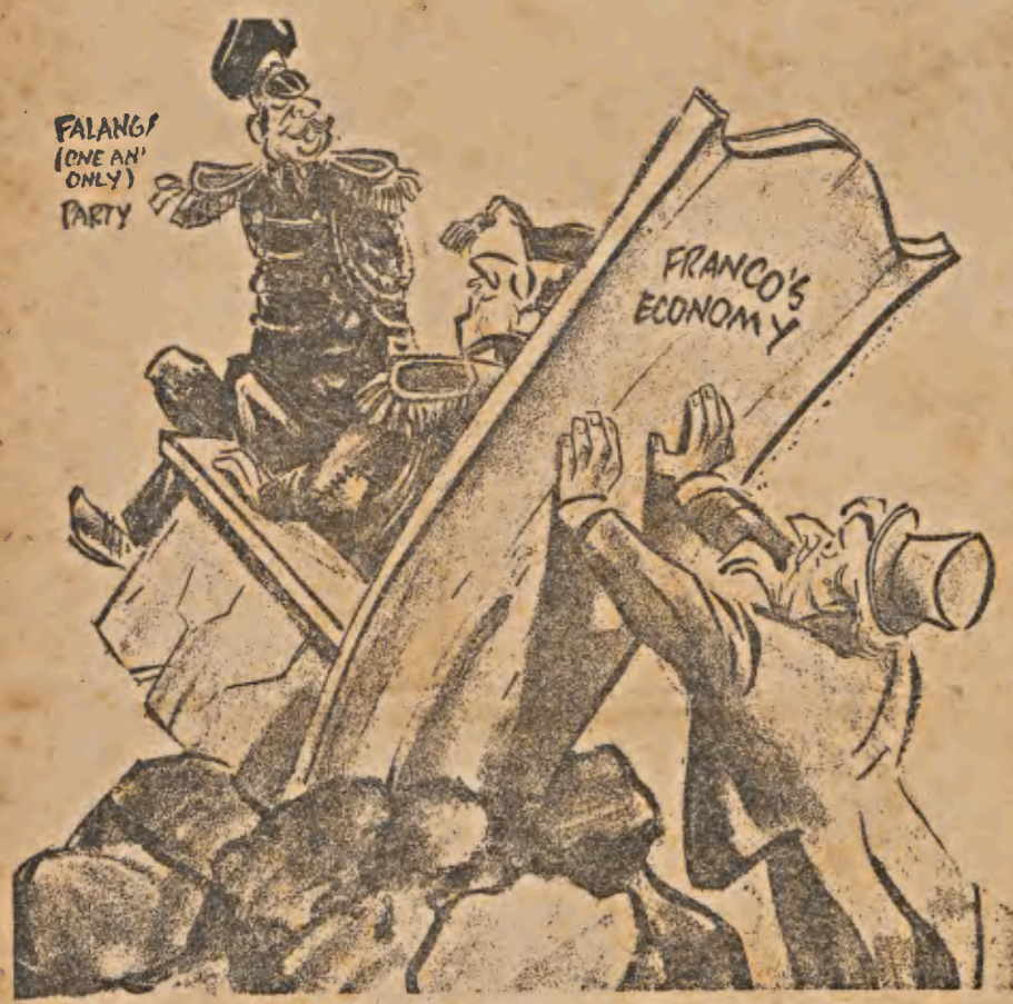
"AHORA, SI ESE HOMBRE SOLAMENTE PUDIERA TOCAR LA GUI-TARRA"