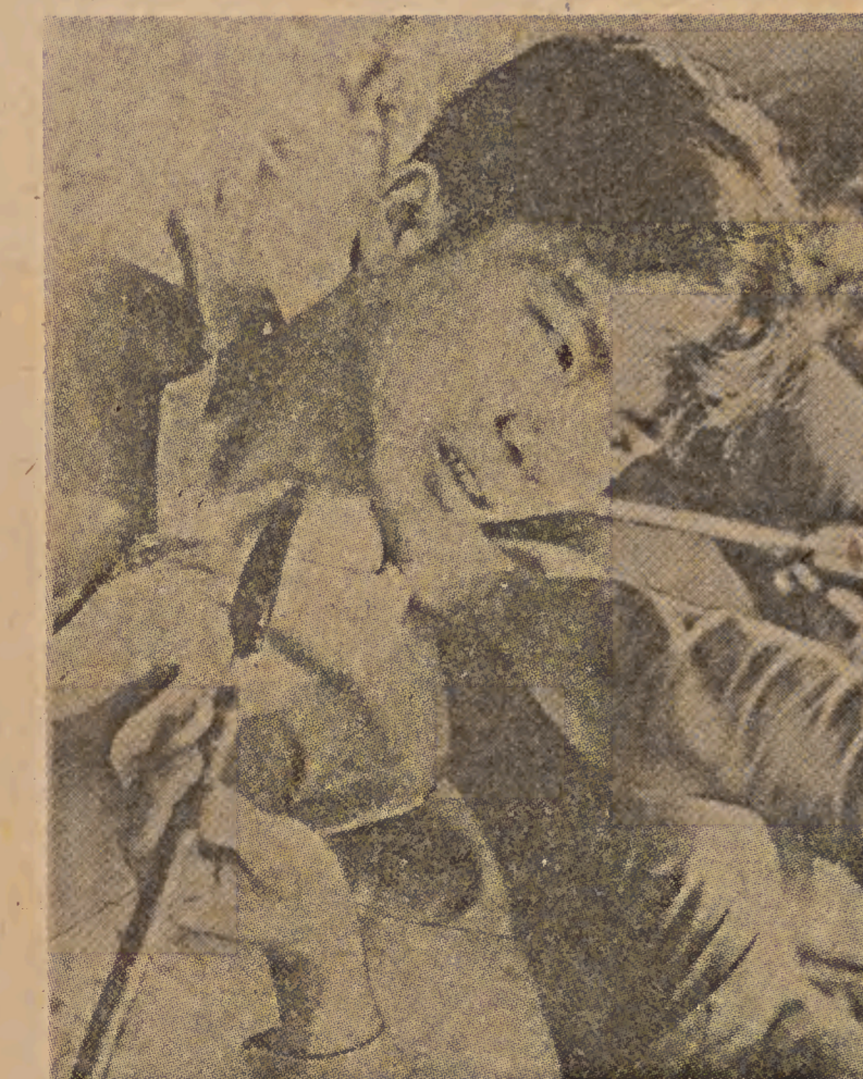
¡La horrorosa barbarie de la guerra!

Del libro Los hijos de Sánchez, de Oscar Lewis. (Página 529).