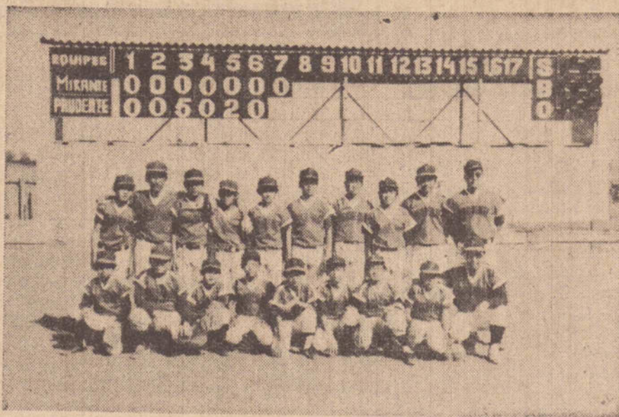
A equipe vencedora do torneio regional e que representará a região, no Campeonato Brasileiro, em Bastos, em julho próximo.

Com as vitórias que obteve sábado sobre Presidente Epitácio — 12 a 0 — sobre Martinópolis (10 a 0) e sobre Mirante do Paranapanema (7 a 0), a equipe de baseball categoria infantil, de Presidente Prudente além de sagrar-se campeã do torneio regional, ganhou o direito de representar a região no próximo Campeonato Brasileiro a realizar-se em Bastos, nos dias 14, 15 e 16 de julho, por ocasião do 50.º aniversário de fundação daquela cidade.