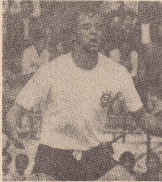
Lance ameaçado no Tribunal.

Advogados corinthianos procuraram providenciar o pedido dos juizes do tribunal, mas segundo informação da Rede Globo de Televisão emissora única que transmitiu a peleja, o tape foi apagado o que pode complicar o caso, pois agora prevalecerá a palavra do juiz e seu relatório, quando afirma ter sido agredido pelo jogador corinthiano. Lance está sujeito a suspensão de até dois anos, com advogados corinthianos procurando provas para inocentá-lo.