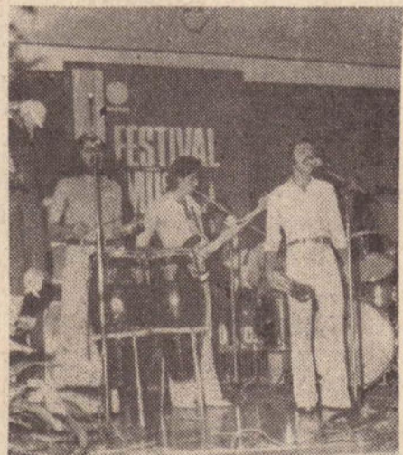
Academicos do samba, interpretando "Batuqueiro".