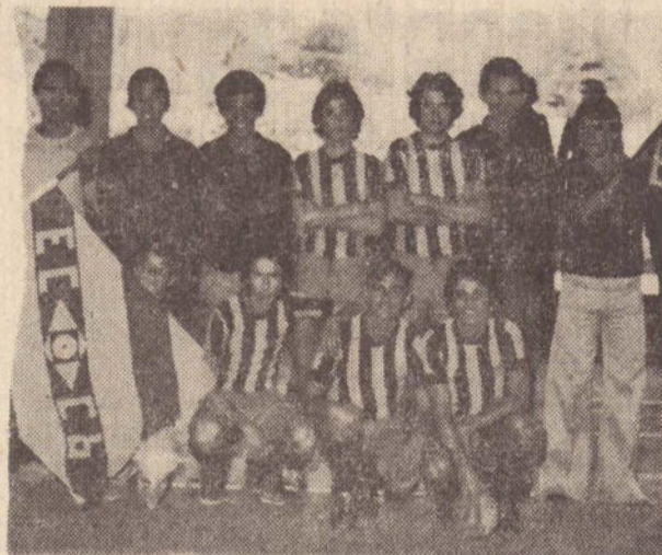
Equipe do E.C. Casas Pernambucanas

Em sua fase de classificação o Campeonato de Futebol de Salão contou com a participação de 16 equipes, onde classificaram-se 6, para a fase final.