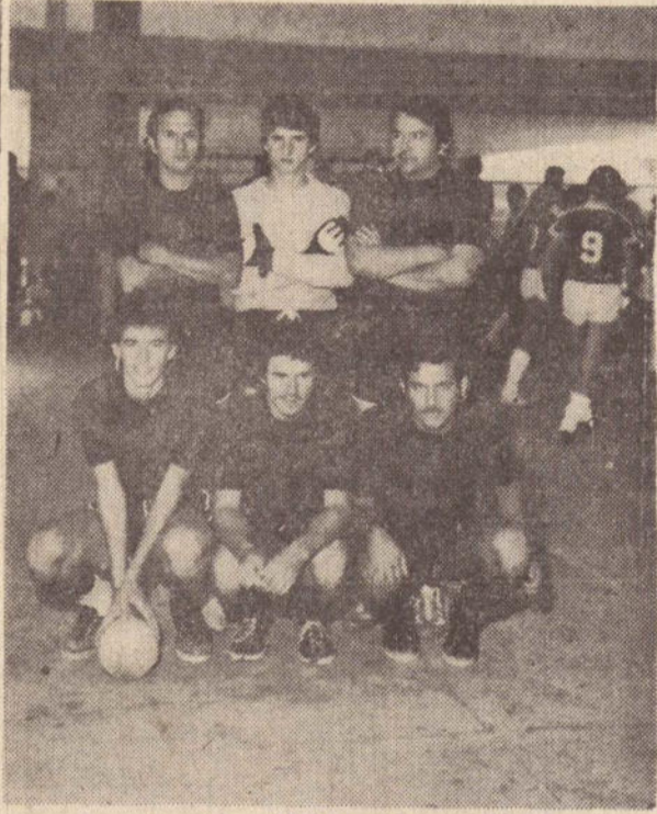
Equipe da Casa Pontalti.

Vem despertando grande interesse aos desportistas locais e da região, principalmente aqueles que trabalham no comércio, a decisão do Camp. Comercial de F. de Salão da temporada, promovido pelo Sindicato dos Comerciantes e SESC, que terá lugar amanhã, às 10 horas na quadra do Colégio Estadual Monsenhor Sarrion.