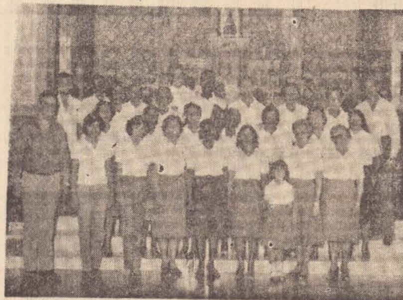
Coral Santa Cecilia, da Vila Marcondes.

São trinta elementos atualmente, dos quais nove da diretoria, e o coral está a disposição para cantar em missas, casamentos, bodas, formaturas, na cidade e região, e também aceita novos elementos, com ou sem experiencia, mas que