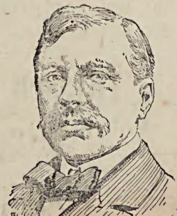
Paul Bourget, der berühmte französische Romanist, der am 2. Dezember seinen 60. Geburtstag feiert.

médie Française meint, die Liebe sei „nicht mehr so tyrannisch wie einst, sie herrsche gewissermaßen konstitutionell“, während eine andere Schauspielerin desselben Theaters, die Silvain, rundweg erklärt: „Man hat nie so gut geliebt, wie zu unserer Zeit.“ Wohl ihr! Massenec, der jüngst verstorbene Komponist, hat geäußert: „Die Werther werden nie aussterben.“ Ein angesehenes Dramatiker, Robert de Fehrs, meint: „In der Liebe gibt es nichts Schlimmes; schlimm ist nur, nicht zu lieben.“ Sein Mitarbeiter Caillavet sagt: „Die Liebenden bleiben einander immer gleich.“ Roman Coolus meint: „Die Liebe weiß sich zu verteidigen. Sie hat weder von dem praktischen Geiste unserer Zeit, noch von dem Sport etwas zu befürchten.“ Der gleichen Ansicht wie die oben erwähnte Silvain äußert auch Basset: „Niemand war die Liebe so schön wie heute.“ Man sieht, die Ansichten über die Liebe gehen nur wenig auseinander, und Franzosen und Französinen sind mit dem heutigen Zustande zufrieden. Nur eine Antwort unter den vielen weicht ab. Sie stammt von dem Senator Béranger, dem Hüter der guten Sitte, der sich folgendermaßen vernehmen läßt: „Ich bitte um Entschuldigung, in Liebessachen bin ich nicht Fachmann.“ - Der Arme!