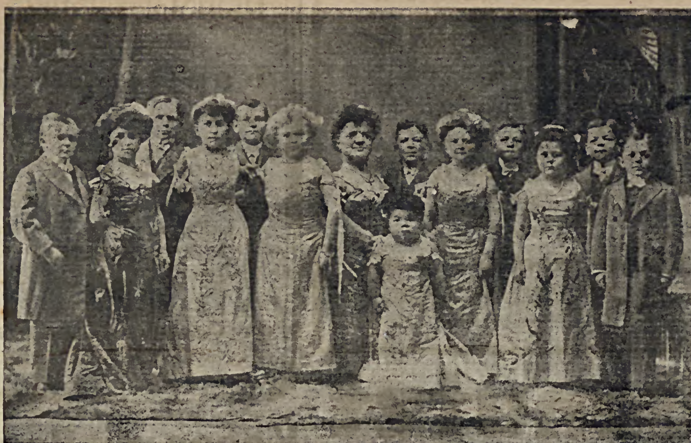
Abwesenheit in ihre liebe deutsche Heimat zurückzukehren.