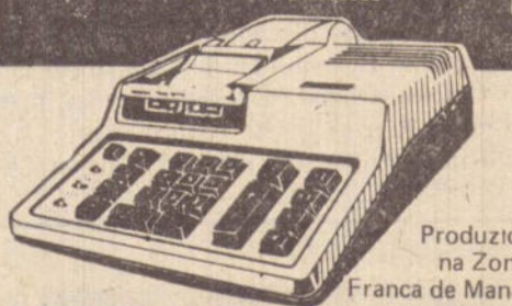
Produzido na Zona Franca de Manaus

SHARP CS-1102 , 10 dígitos, (K), memória, raiz e %. A vista CR$ 1.521,00 ou 12 x 156,52