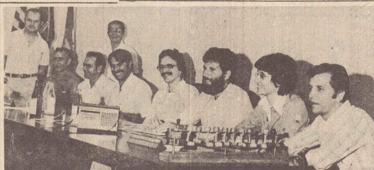
Um aspecto da mesa que presidiu os trabalhos ontem, na Câmara Municipal