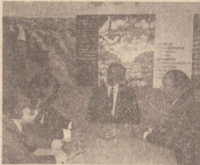
São Paulo — (CBI) — O secretário do Interior, Hugo Lacorte Vitale, em visita às instalações do Consórcio Brasileiro de Imprensa, declarou que somente a partir de uma verdadeira descentralização estadual, o Interior de

São Paulo poderá atingir as suas metas de desenvolvimento. No momento em que diz isso, o secretário assume um ar bastante sério e revela que essa descentralização é um compromisso que o Governo Laudo Natel assume e que colocará na prática durante o seu mandato. «Trabalharemos incansavelmente e haveremos de descentralizar o ensino, as repartições públicas, as indústrias, até ao ponto de fixar o homem interiorano e levá-lo a sentir, em sua própria região, a capacidade de um território altamente desenvolvido, suficiente para lhe oferecer eficientemente, as respostas práticas às suas necessidades e anseios».