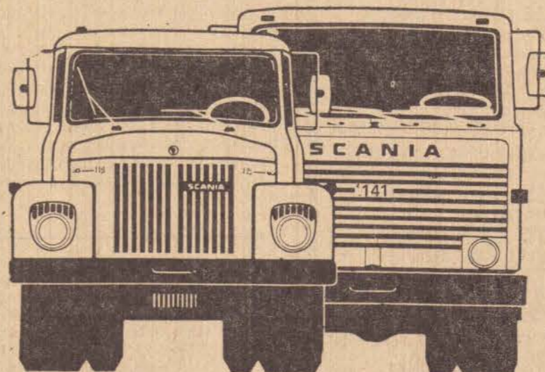
L - 111

Convidam seus clientes e amigos para visitarem a FAPI-14a. Feira Agro-Pecuária e Industrial e 7a. Exposição de Animais e Produtos Derivados da região de Marília, que se realiza de 10 a 18 de Maio em Ourinhos.