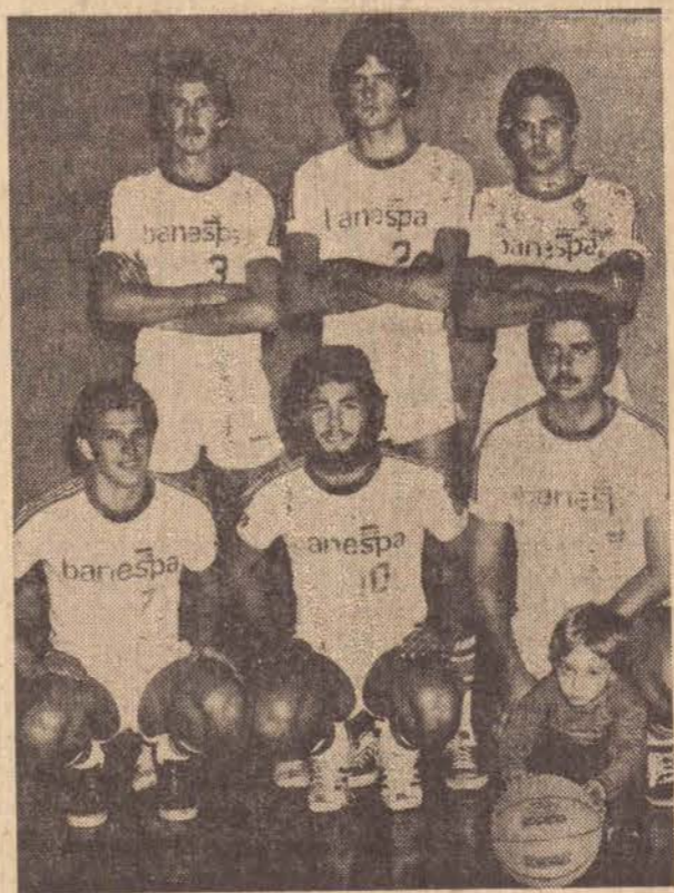
Equipe da ASSESB, que estará decidindo o 3.º e 4.º lugares.

As quadras de esportes, do Parque de Uso Múltiplo, serão utilizadas, oficialmente na manhã de amanhã com a decisão da Modalidade de Basquetebol, do Campeonato de Basquetebol do Sindicato dos Bancários, fazendo parte da III Olimpíada Bancária.