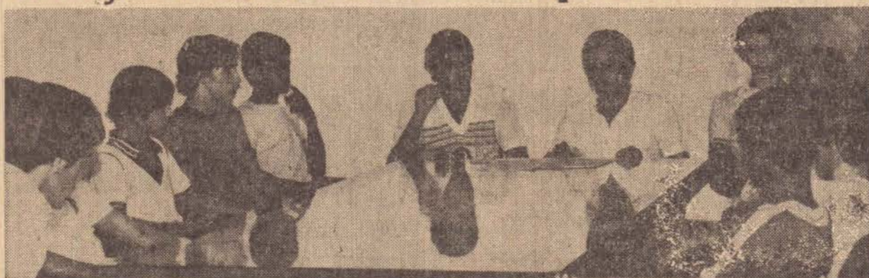
Flagrante colhido quando da apresentação dos convocados no ultimo sábado

A Seleção Amadora de Futebol da Autarquia Municipal de Esportes, especialmente convocada para defender o nome de nossa cidade nos Jogos Regionais da Zona Oeste na cidade de Ourinhos no próximo mês de julho, realizou na noite da ultima quarta-feira no Estádio da Cia. Elétrica Caiuá, o seu primeiro treino, iniciando desta forma os treinamentos para os Jogos.