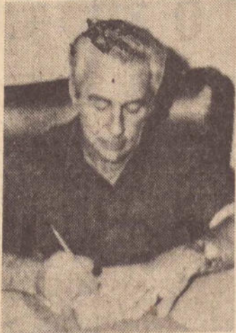
Prefeito Manoel Rainho

Na expectativa de podermos contar com tão valiosa colaboração até o encerramento da campanha, dia 30 de abril próximo, antecipamos, e apresentamos a Vossa Senhoria, protestos de consideração e apreço".