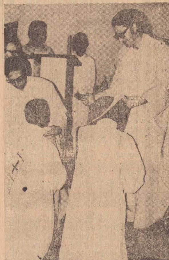
a Eucólis. Em seguida os novos diáconos recebem o abraço do Bispo.