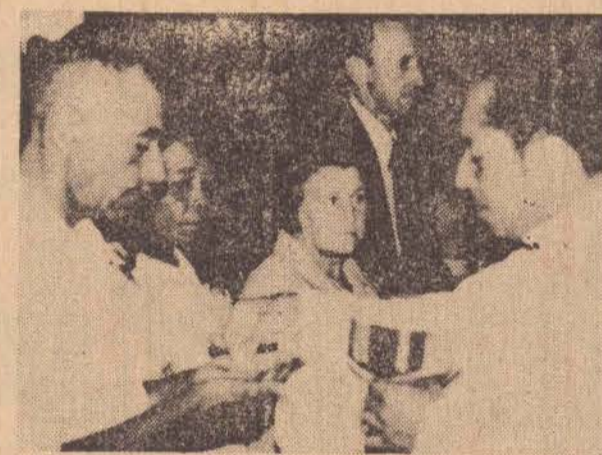
Depois de ordenados, os diáconos distribuem o pão sagrado, primeiro aos próprios pais e depois aos demais fiéis que vão à comunhão.