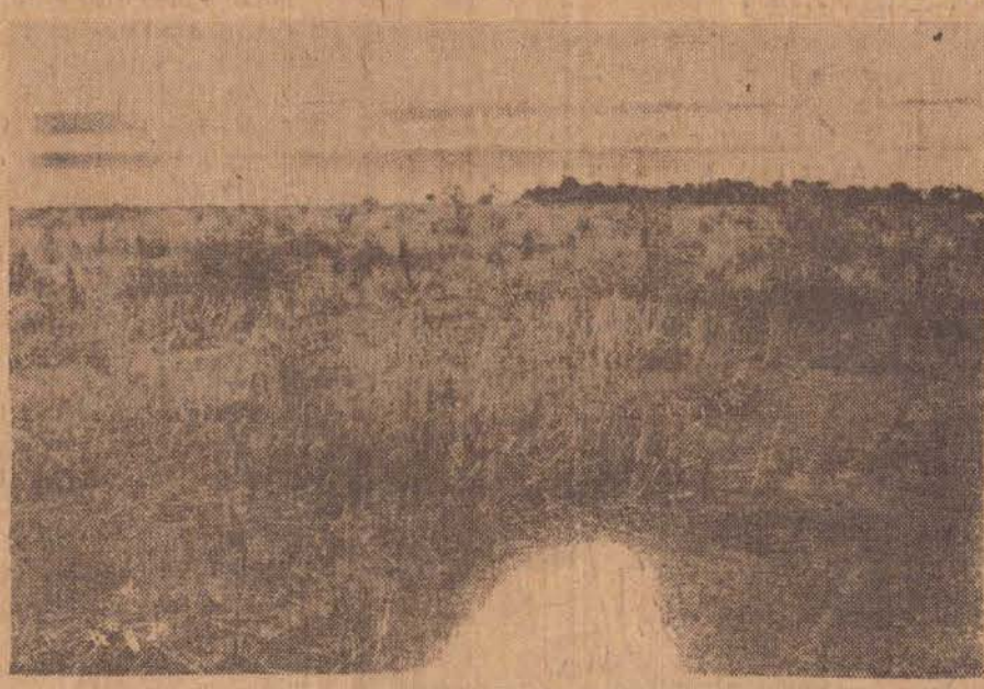
O terreno ocupado pela palhada, vai ser transformado com a nova tecnologia.