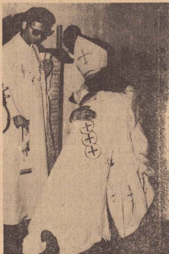
O Bispo senta-se e mitra. Os ordenados levantam-se e os prebiteros impõe a cada um