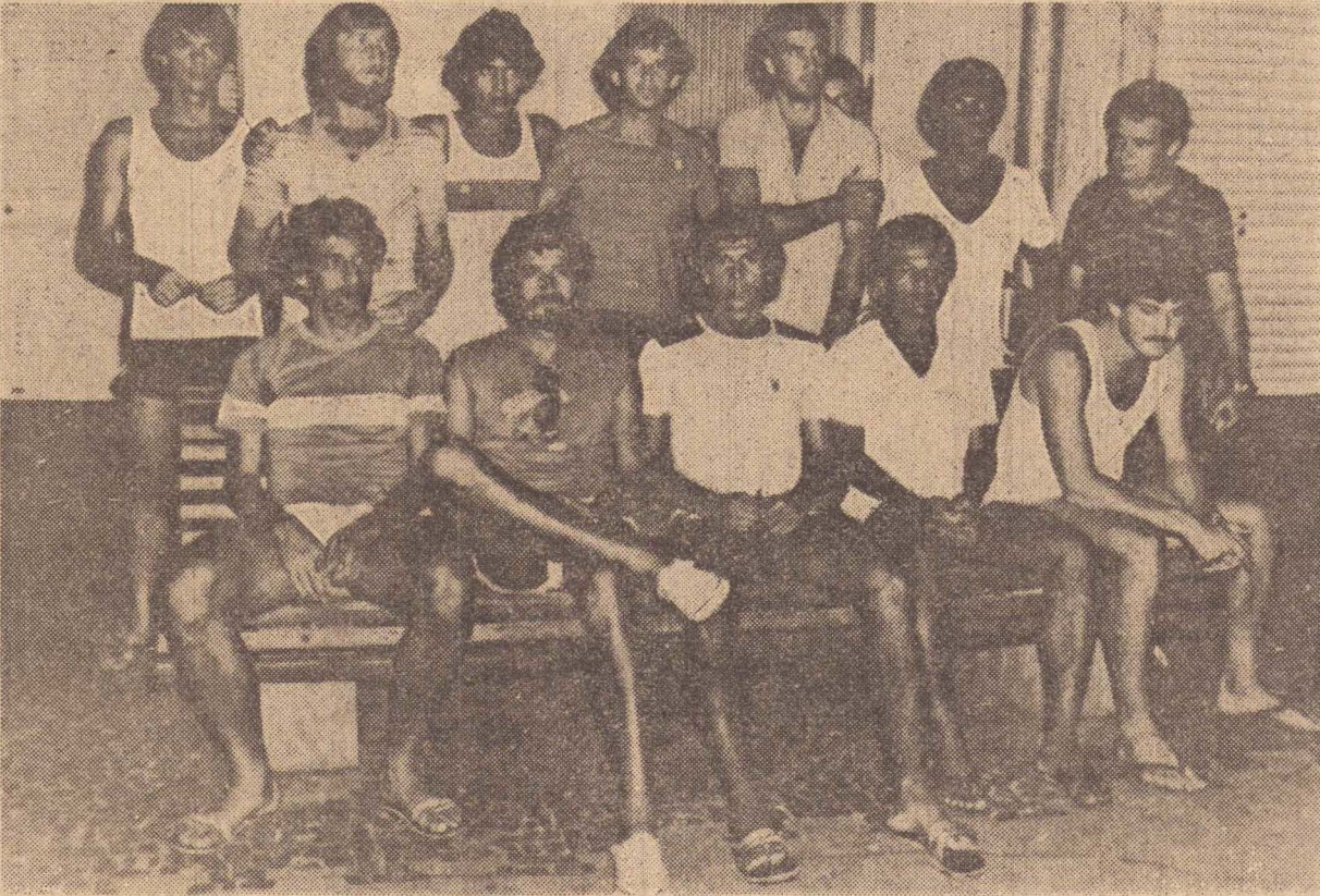
Sentados em pleno Calçadão, atletas do Corinthians PP dizem passar necessidades.