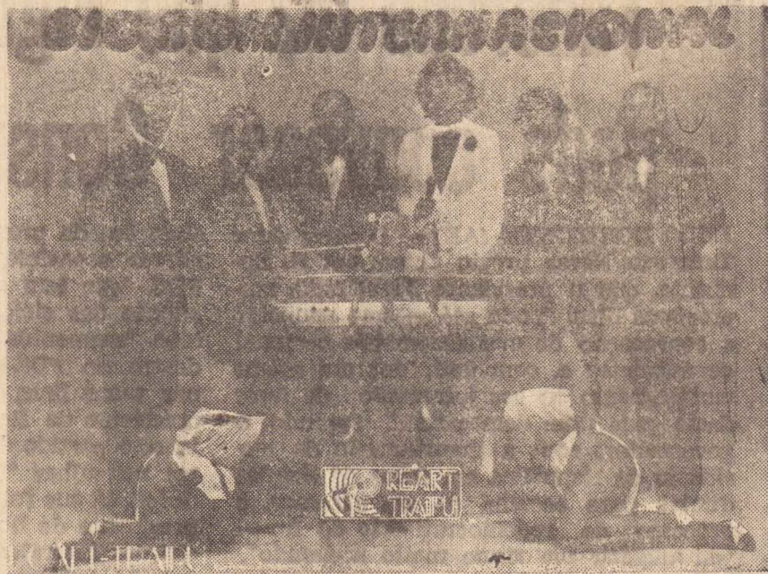
Big Som Internacional

O conjunto tem oito elementos, todos excelentes músicos, duas cantoras com be-