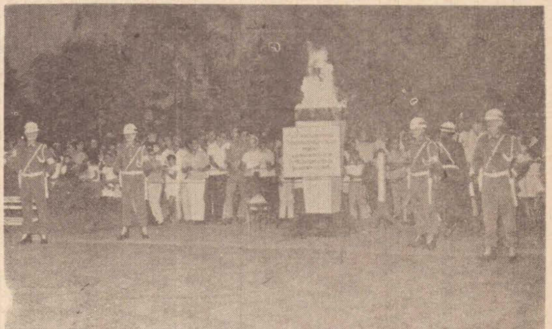
No clichê, vêem-se Soldados do P.P.O., Pelotão de Policiamento Ornamental do 18.º B.P., quando montavam guarda de honra a Pira do Fogo Simbólico da Pátria. Salve 23 de maio de 1967.

O inverno demora-se este ano, quando praticamente atingimos o mês de junho. Contudo, ele está sendo esperado de maneira rigorosa nos meses de junho e julho, com temperaturas abaixo de zero nos estados do Sul, como Rio Grande do Sul, Sta. Catarina e até o Paraná, sobrando alguma coisa para nós.