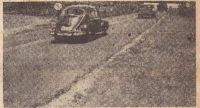
O trânsito nas estradas da região, é feito agora com muita dificuldade.

A interrupção do tráfego na Rodovia Raposo Tavares e no ramal de acesso a S. José do Rio Preto, é devida principalmente às obras de reconstrução que estão sendo feitas por diversas empreiteiras em cumprimento a contrato celebrado com a Secretaria dos Transportes, através do DER.