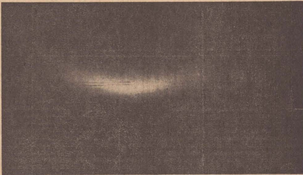
Esta fotografia sofreu uma ampliação no laboratório do jornal

possível. A entrega está prevista para o fim do mês de outubro ou início de novembro. Estão sendo dadas prioridades as ruas que não possuem asfalto, mas que estão no plano de pavimentação elaborado pelo prefeito Osvaldo Quaglio a fim de que os trabalhos de pavimentação possam ser iniciados o mais rápido possível. ESTRADA ASFALTADA PODERÁ TER INÍCIO BREVEMENTE Segundo informações do prefeito Osvaldo Quaglio a implantação e pavimentação do acesso asfáltico ligando o seu município a Prudente deverá ser iniciada brevemente. Sua informação é alicerçada em dados colhidos junto ao governador Paulo Egídio, quando de sua visita ao Pontal, assim como, informações dos dirigentes da firma Beter, de São Paulo, vencedora da concorrência pública. A implantação dessa estrada será, segundo a opinião da maioria, o maior cabo eleitoral da Arena nesta região, mas, para isso, os trabalhos deverão estar bem adiantados na época das eleições.