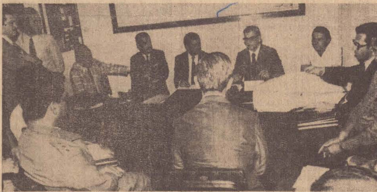
Aspecto da reunião do Secretario com as autoridades locais no 18.º BPM

Limitamo-nos a publicar a fotografia, sem atribuir-lhe qualquer comentário sobre sua importância para esclarecimento de um fenômeno, pelo menos visual.