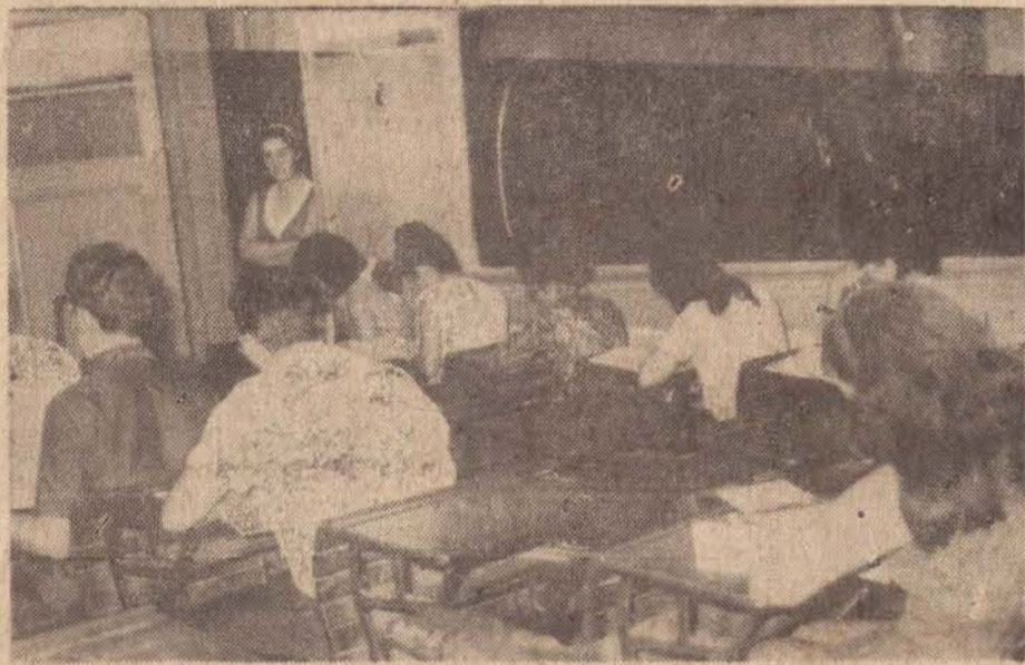
Os professores — em número de 668 — estão espalhados pelos estabelecimentos locais, para as provas do concurso de ingresso no Magistério primário.