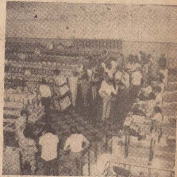
Seis caixas registradoras estão localizadas na entrada do Supermercado Pastorinho, a fim de melhor atender a sua clientela. Por sinal o público, logo nos primeiros momentos que sucederam a inauguração foi imenso, tendo as senhoras apanhado os carrinhos e realizado as primeiras compras.

Tendo a inauguração coincido com as festas natalinas, a direção do Super Mercado Pastorinho se preocupou em (Conclui na 6.ª Página).