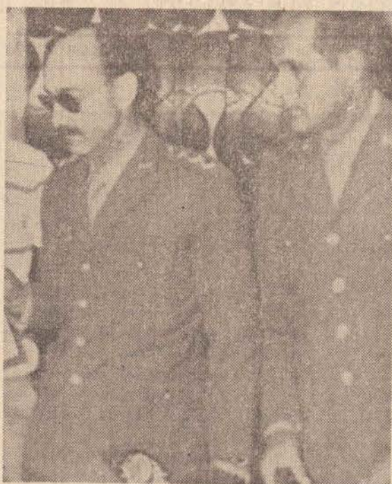
Os dois militares em nossa redação