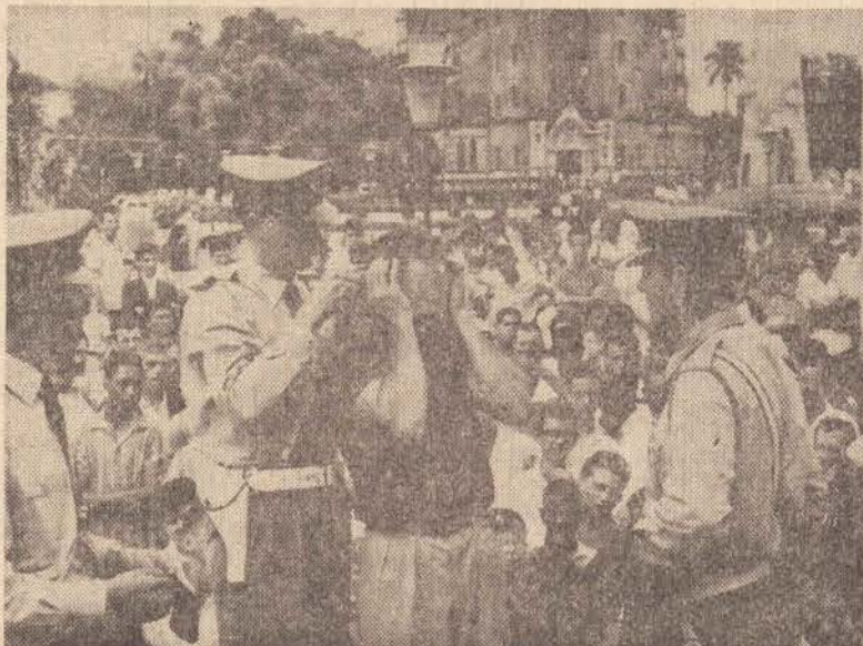
Espectáculo como o de dirigir veículos com os olhos vendados...

Após essa exibição do próximo dia 2, o "Maluco do Espaço" estará se preparando para acrobacias aéreas, em setembro, por ocasião do aniversário de Presidente Prudente.