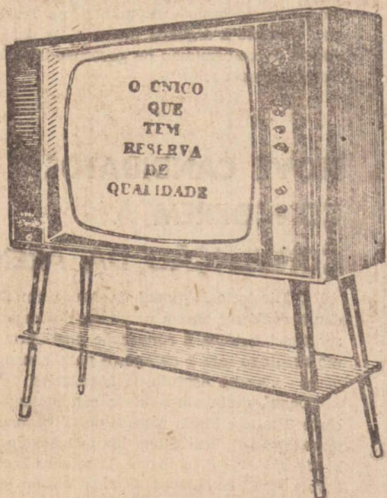
Imagem e som de presença total, com Reserva de Qualidade.