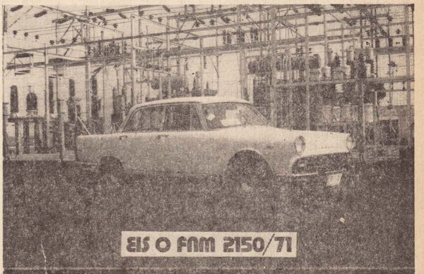
ÉIS O FNM 2150/71

KANEKO DIESEL S.A. Rua Antonio Rodrigues, 1.210 Fones: 3.3781 e 3.4670