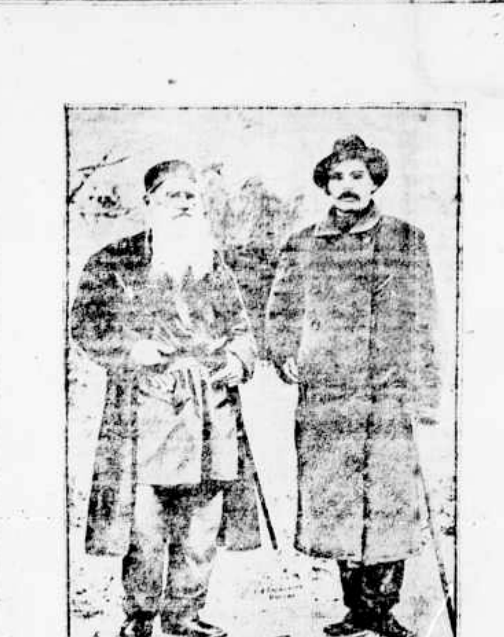
Толстой и Горький

Digo mal dizendo simplesmente que querem, porque já estabeleceram essa servidão com a abertura de duas portas e construção de uma sentina á irmandade, para evitar dividas e quebras judiciais, resolveu fazer um muro de ferro, perdendo nossa porção da pequena area, que era sua desde mais de um século.