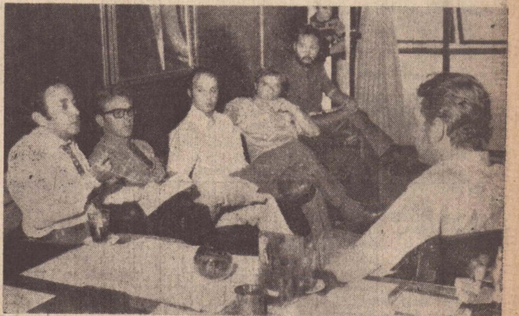
O representante do SERFHAU explica a implantação do Cadastro Técnico Municipal

O CADASTRO O Cadastro Técnico Municipal é um conjunto de arquivos que contem o registro de dados de base imobiliária urbana. As finalidades mais imediatas do CMT se referem ao planejamento físico e controle do uso do solo, à arrecadação municipal e a implantação (Conclui na 6.ª pagina)