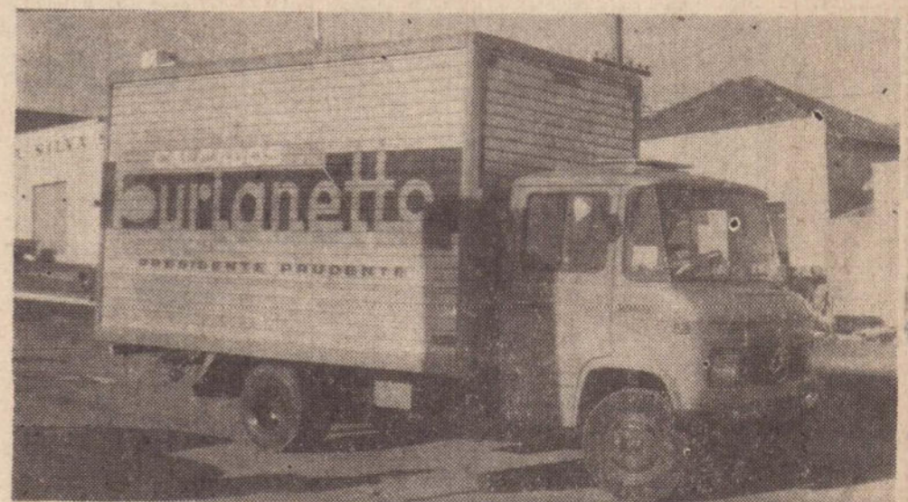
L-608 D — (MERCEDINHO) — Mais um produto da