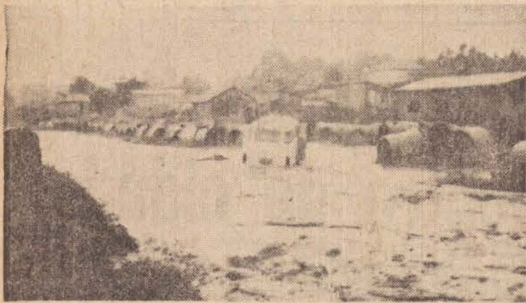
A enxurrada tomou aspecto de um rio, tal o volume de água.