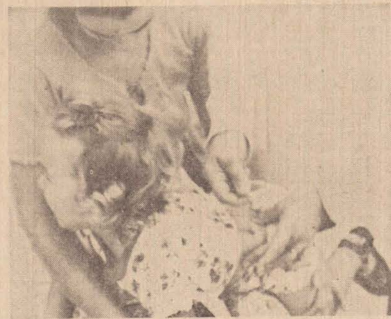
As autoridades da saúde estão tentando aumentar o índice imunitário da população menor de 5 anos, intensificando a vacinação.