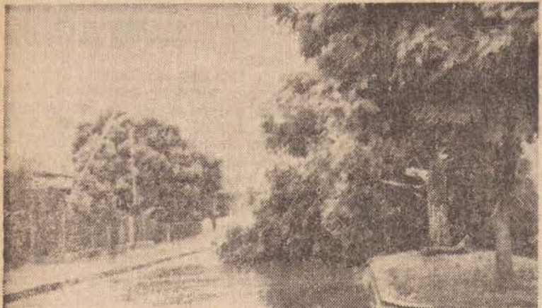
Muitas árvores não suportaram a força dos ventos.

O município de Regente Feijó foi surpreendido 2ª feira a tarde por um vendaval acompanhado de granizo e com muita chuva. Todavia, os danos foram pequenos como a queda de algumas árvores. Por outro lado, no Bairro Vila Assumpção a enxurrada que atingiu o nível de cinquenta centímetros de altura impediu o tráfego