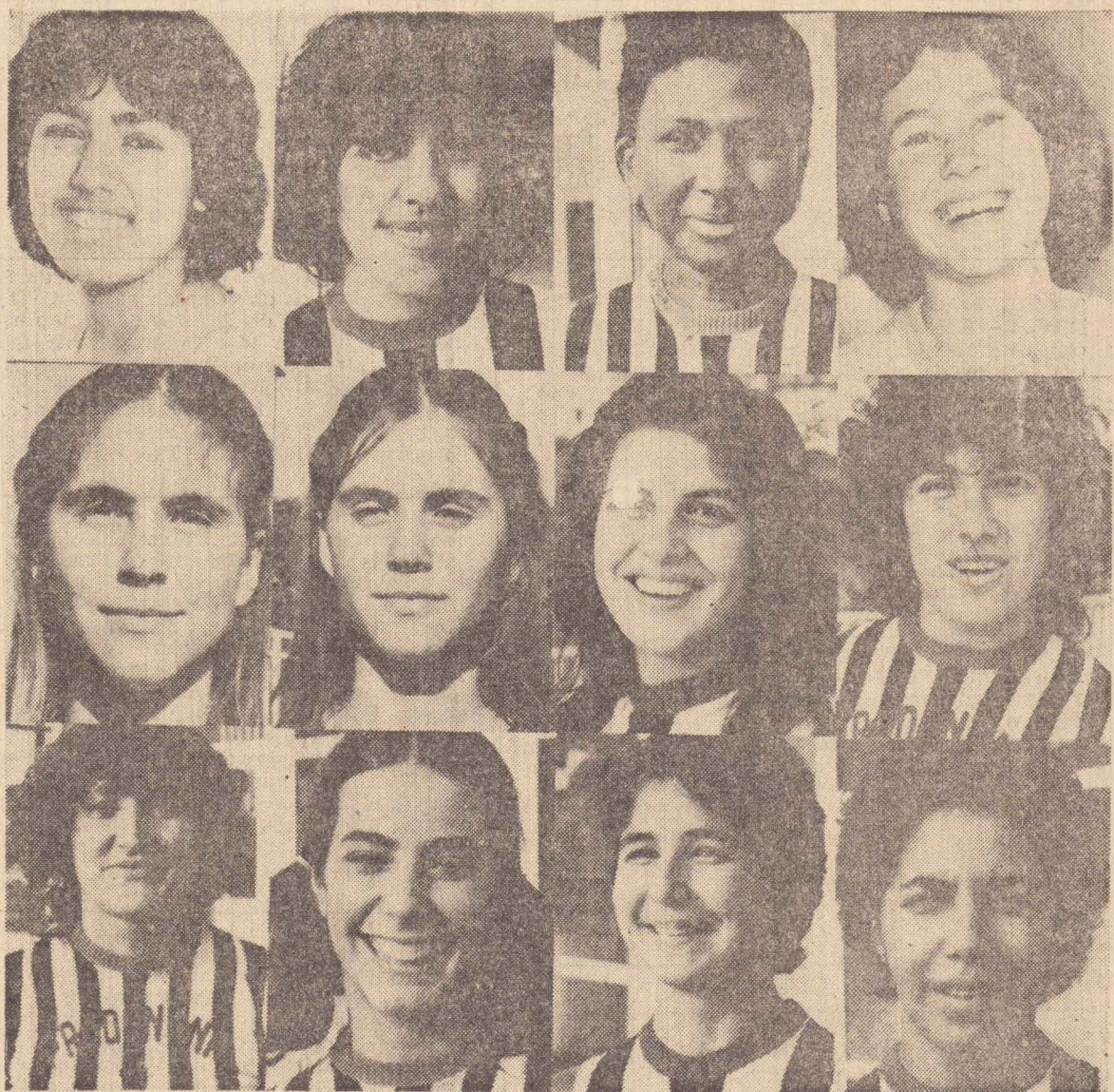
Atletas da equipe de Basquetebol Feminino da Apea

Grande publico deverá comparecer na noite de hoje no Ginásio de Esportes da Associação Prudentina de Esportes Atlético, ocasião em que a equipe de basquetebol feminino da Prudentina estará enfrentando a equipe do Pirelli de Santo André, equipe vice campeã paulista, em partida válida pelo Campeonato Paulista da Divisão Especial da Federação Paulista de Basquetebol. Todo associado da Prudentina deve prestigiar este grande acontecimento esportivo. Enquanto os adultos e os jovens estiveram no Ginásio de Esportes, as crianças dos associados estarão numa festa sem precedentes nos salões de festas da APEA, numa promoção do Departamento Social, onde brindes e diversas brincadeiras marcarão a comemoração do Dia da Criança. Tudo isso é mais um motivo para que os pais compareçam a APEA, prestigiem o basquetebol e levem suas crianças para a festividade alusiva ao Dia da Criança.