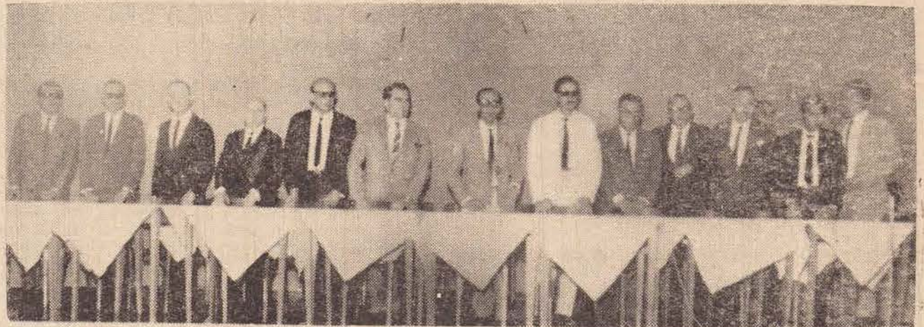
Composição da mesa que era formada para os debates na manhã de domingo na APEA.