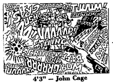
4'3" — John Cage