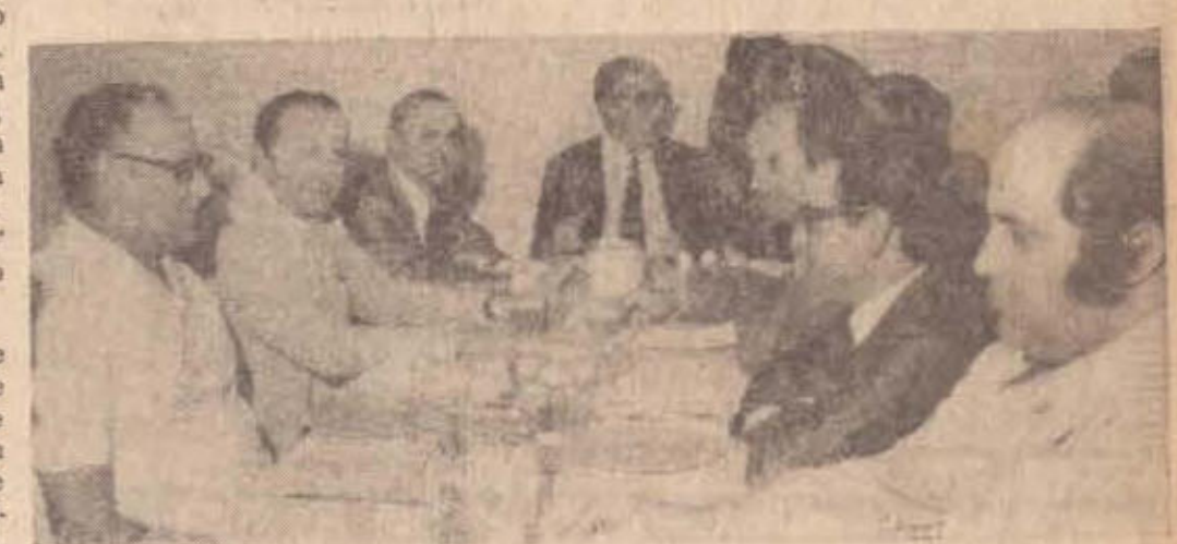
DEPOIS DAS VISITAS, UM JANTAR DE CONFRATERNIZAÇÃO.