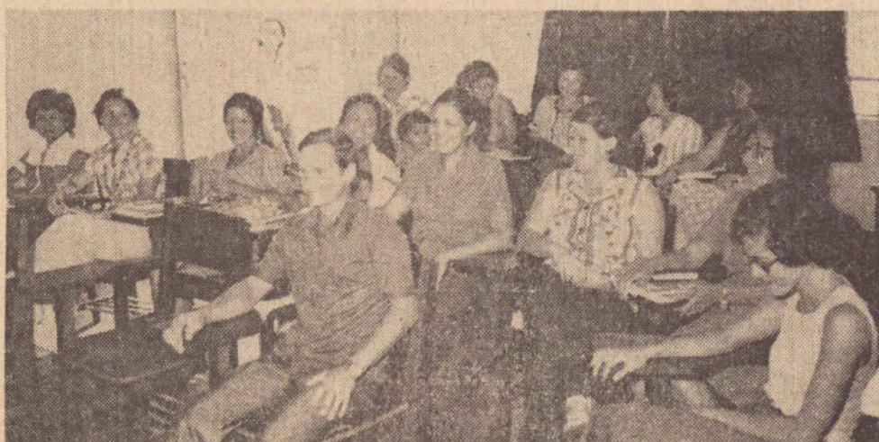
Monitoras do MOBRAL substitutas de grupos escolares, iniciam neste sábado, o censo, na periferia prudentina. (Reportagem completa na página 4)