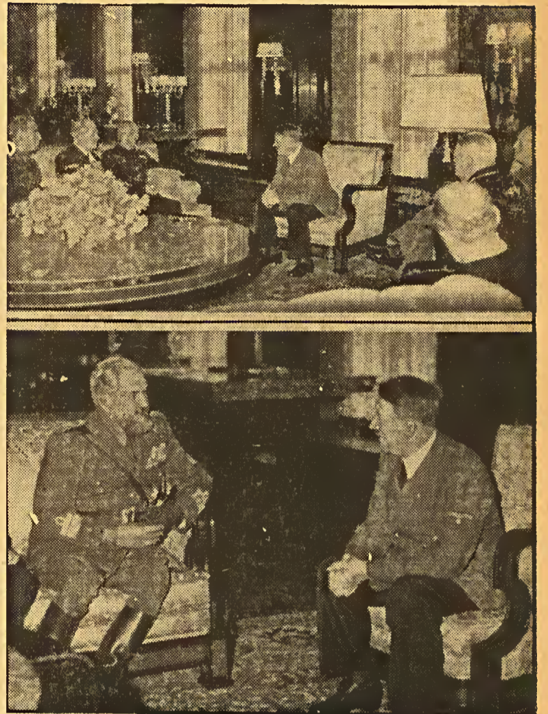
Spanische und italienische Minister in Berlin. — Der spanische Innenminister Serrano Suñer (oben) und der italienische Kolonialminister General Teruzzi (unten) wurden von Führer in der Neuen Reichskanzlei empfangen.

Berlim recebe a visita de um ministro hespanhol e de um ministro italiano. — O ministro do Interior hespanhol, Serrano Suñer (em cima), e o ministro das Colonias italiano, general Teruzzi (em baixo), foram recebidos por Hitler, na nova Chancellaria do Reich.