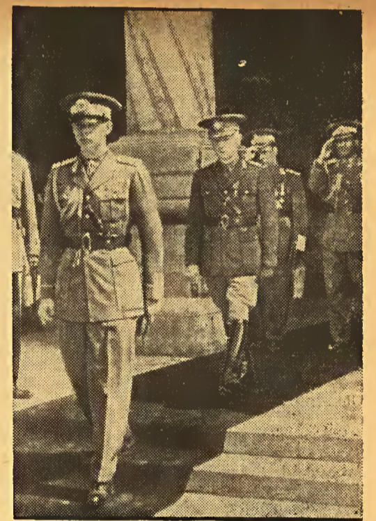
König Michael I. von Rumänien verlässt nach dem Dankgottesdienst aus Anlass seiner Thronbesteigung die Kathedrale von Bukarest. Hinter ihm Ministerpräsident General Antonescu.

O rei Miguel I da Rumania, em flagrante apanhado ao deixar o jovem soberano da Rumania a Cathedral de Bucarest, depois de uma acção de graças pela sua ascensão ao throno. Logo atrás do rei vê-se o presidente do Ministerio, general Antonescu.