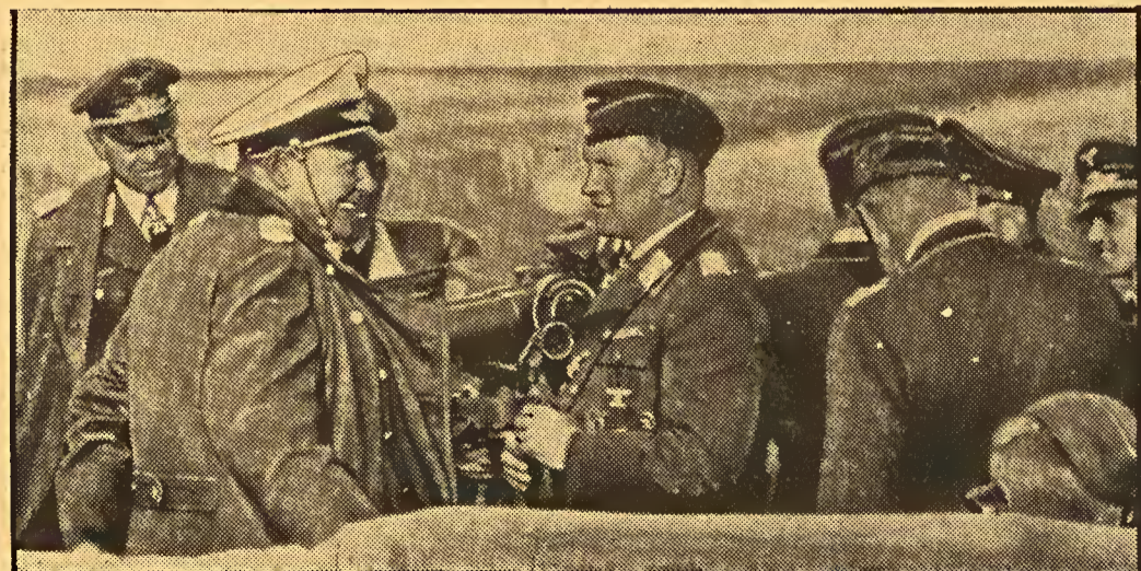
Reichsmarschall Hermann Göring leitet persönlich den Grosseinsatz der deutschen Luftwaffe gegen England.

O marechal do Reich Hermann Goering dirige, pessoalmente, os ataques de larga envergadura da Arma Aérea teuta á Inglaterra.