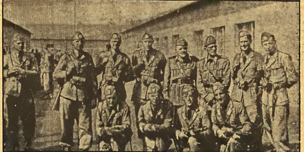
Deutsche in Abessinien, die sich in Stärke von zwei Kompanien freiwillig den italienischen Truppen angeschlossen haben und auf italienischer Seite an den Kämpfen teilnehmen.

Allemaes na Abyssinia, que, constituindo duas companhias, se juntaram, voluntariamente, as tropas italianas, ao lado das quaes participam dos combates.