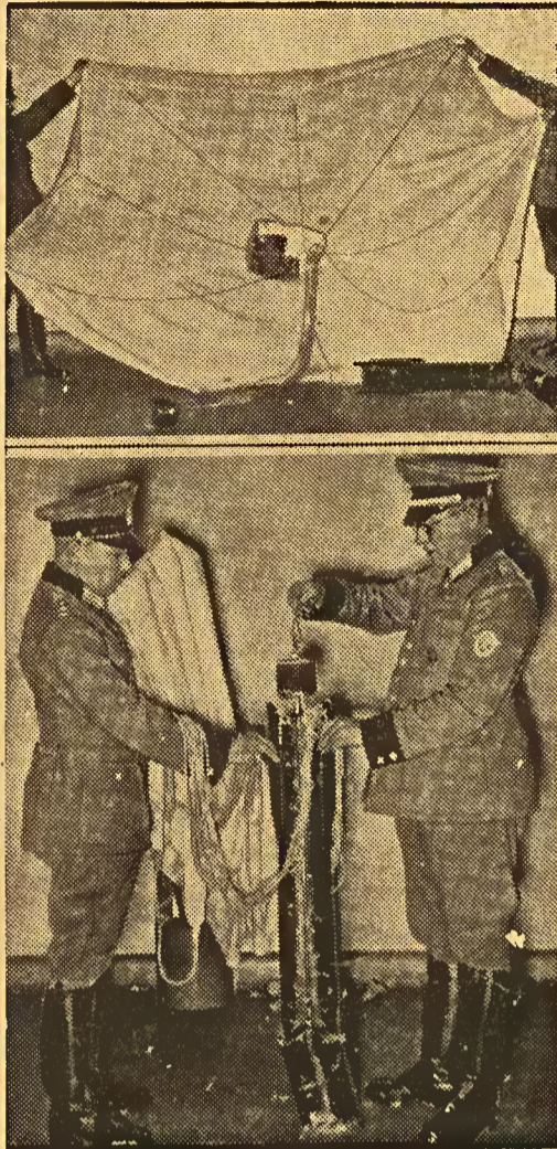
Ein Leuchtfallschirm der englischen Nachtpiraten. Eine über Berlin abgeworfene Leuchtbombe. — (Oben): Der Fallschirm in seiner vollen Grösse; (unten): der Schaft, in dem der Fallschirm und der Leuchtstoff untergebracht sind.

Páraquedas illuminador dos piratas nocturnos ingleses. — Eis aqui uma bomba iluminadora lançada sobre Berlim. Vemos em cima, o páraquedas desdobrado para mostrar seu tamanho; e, em baixo, o estojo portador do páraquedas e da materia luminosa.