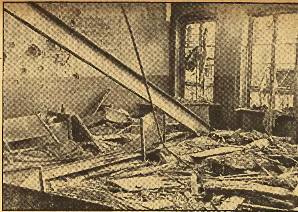
Furchtbare Zerstörung in Bethel. — Mit dem Bombardement auf die in der ganzen Welt bekannten Bodelschwinghschen Heilanstalten in Bethel bei Bielefeld, bei dem neun kranke Kinder getötet und zwölf schwer verletzt wurden, reihte die R.A.F. das grausamste und gemeinste Verbrechen an ihre bisherigen Schandtaten. — Zerstörter Schlafsaal im Haus „Neu-Bethel“, in dem acht Kinder ums Leben kamen.

Enormes danos em Bethel. — Com o lançar suas bombas sobre o Sanatorió de Bodelschwingh, em Bethel, junto a Bielefeld, ocasião em que foram mortas nove crianças enfermas e gravemente feridas outras doze, a R.A.F. juntou o mais barbaro e o mais infame dos crimes aos vergonhosos actos até aqui perpetrados. A photographia apresenta um dormitorio na Casa „Neu-Bethel“, em que pereceram oito crianças.