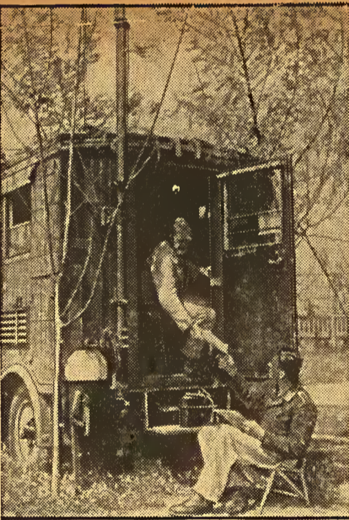
Eine Funkstation auf einem Feldflugplatz im Westen, die zur Nachrichtenübermittlung an die im Feindflug befindlichen Maschinen dient und gleichzeitig die Meldungen von den Geschwadern aufnimmt.

Estação de radio emissora e receptora alemã num campo de aviação militar, no occidente. Destina-se exclusivamente á transmissão e recepção de mensagens de interesse das Forças Aéreas teutas.