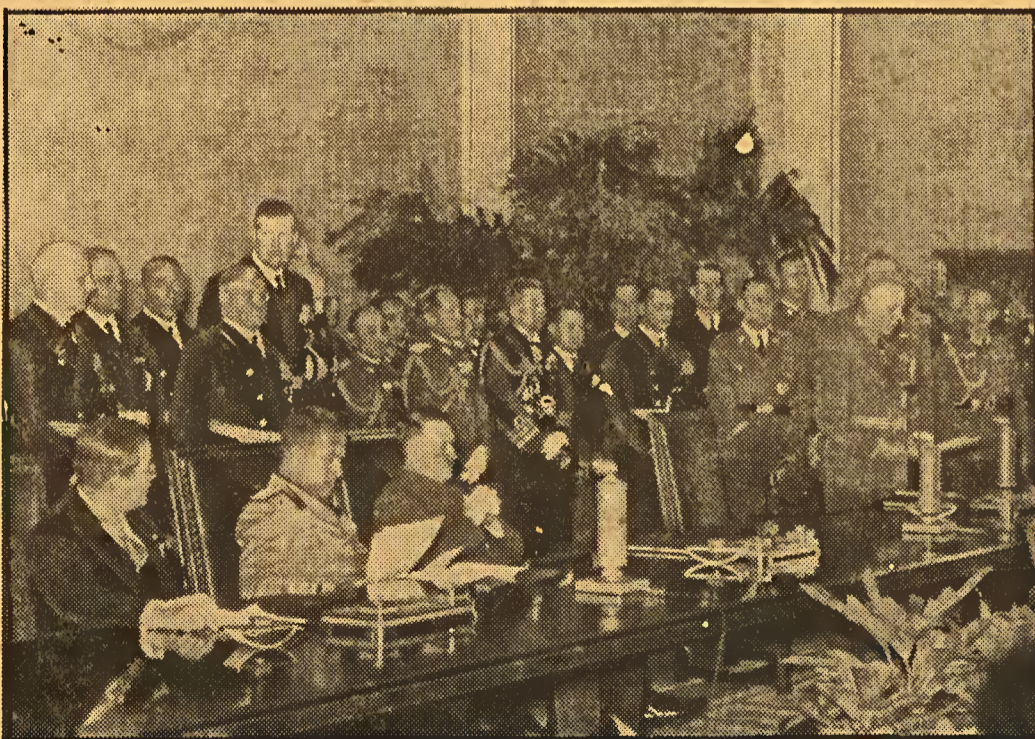
Verkündung der Reichsregierung in der Reichskanzlei: Abkommen Deutschland-Italien-Japan. — Reichsminister des Auswärtigen von Ribbentrop spricht.

O pacto Alemanha-Italia-Japão. — Photographia tirada no momento em que falava o ministro do Exterior do Reich, barão von Ribbentrop, lendo a proclamação do governo allemão, na Chancellaria do Reich.