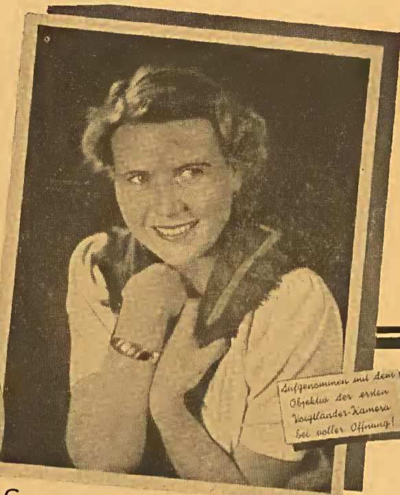
Aufgenommen mit dem Objektiv der ersten Voigtländer-Kamera bei voller Öffnung!

Sie meinen, diese Aufnahme wäre mit einem modernen Objektiv gemacht? Irrtum, denn das Objektiv ist im Jahre 1840, also vor fast 100 Jahren gebaut.