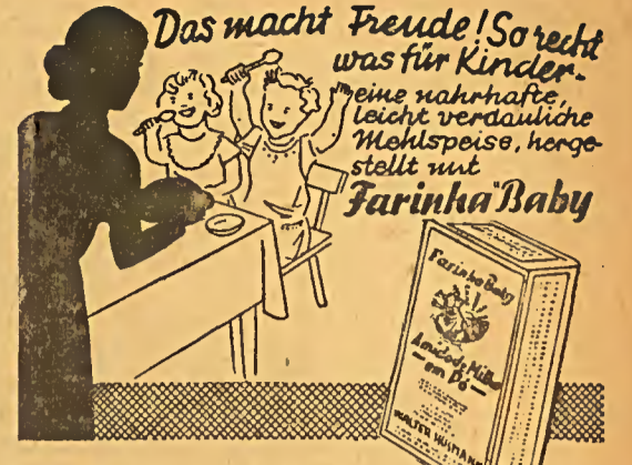
Farinka "Baby" ist aus feinstem Mais-Stärkepulver hergestellt und dient zur Zubereitung von Süssspeisen, Cremes, Suppen, zum Backen vieler Feingebäcke u. s. w. Auf Grund seiner vielseitigen Verwendbarkeit ist daher Farinka "Baby" in jedem Haushalt unentbehrlich. Farinka "Baby" sowie Dr. Oetker's Backpulver, "Backin", Puddingpulver, Vanillinzucker, u. s. w. sind in allen besseren Lebensmittelgeschäften zu haben.