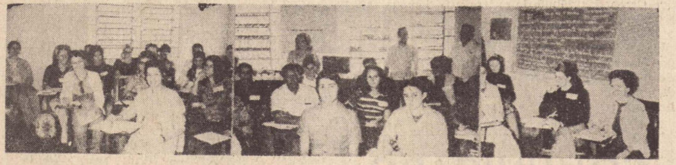
Pela "Operação Multiplicacional" cada monitor tem a incumbência de treinar outros trinta.