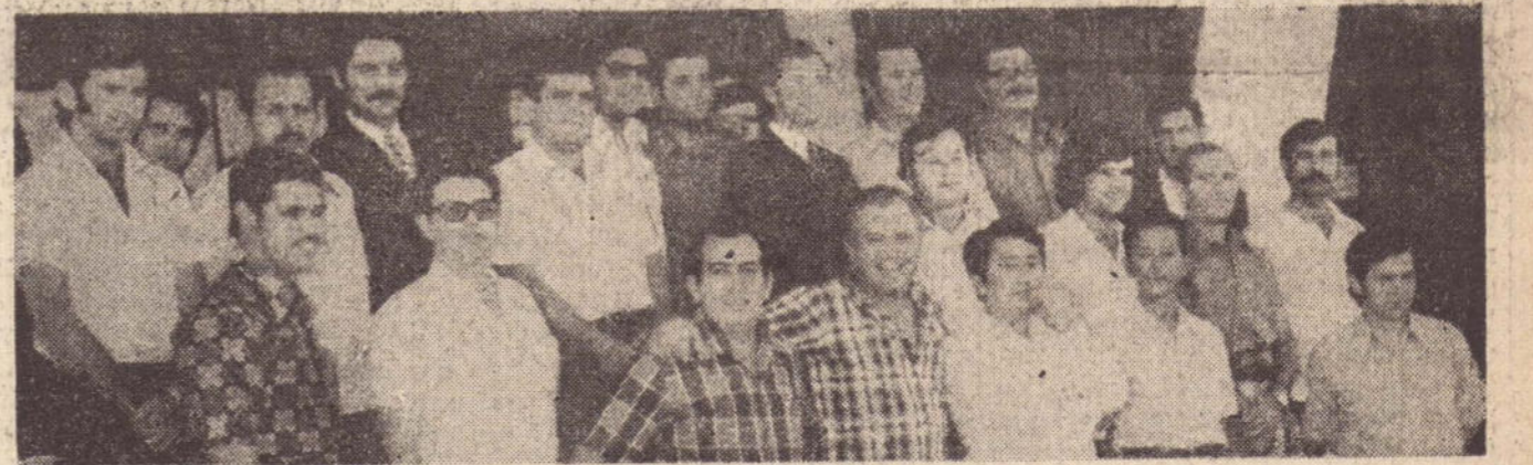
Num flagrante especial, aí estão os participantes e instrutores do curso promovido em Presidente Prudente pelo Instituto Ford de Marketing.

No seu retorno, é possível que tenhamos mais algumas novidades.