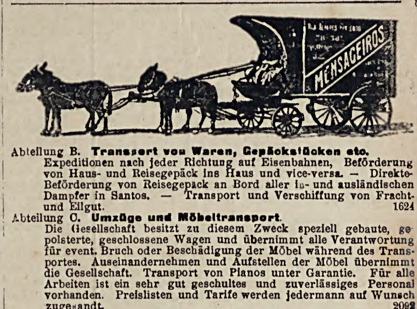
Abbildung B. Transort von Waren, Gepäckstücken etc. Expeditionen nach jeder Richtung auf Eisenbahnen, Beförderung von Haus- und Reisegepäck ins Haus und vice-versa. - Direkte Beförderung von Reisegepäck an Bord aller in- und ausländischen Dampfer in Santos. - Transport und Verschiffung von Fracht- und Eilgut. 1624