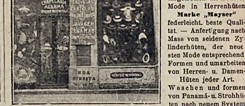
Erstklassiges Herren- und Damen-Hutgeschäft empfehlen alle in- und ausländischen Waren. Herren- Damen- und Kinderhüte zu mässigsten Preisen - Soben eingetroffen die neueste Mode in Herrenhüten - „Mäster“, „Mäster“ federleicht, beste Qualität - Anfertigung nach Mass von seidenden Zylinderhüten, der neuesten Mode entsprechend Formen und unmarbenten von Herren- u. Damen-Hüten jeder Art. Waschen und formen von Panamá-u. Strohhüten nach neuem System

von Henrique Möntmann & Co. S. PAUL Rua Direita No. 10-B S. PAULO