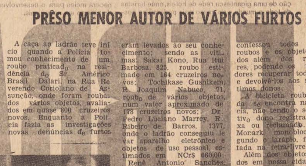
Foto de um dos autores dos furtos praticados em Presidente Prudente.