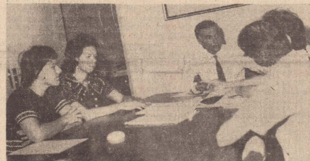
A ASSOM e a DRS-10 buscam soluções imediatas para os internamentos psiquiátricos na região.

A tendência atual da situação de internamento de doentes mentais em Pres. Prudente é a de um atendimento mais qualificado, com diagnósticos completos, — especialmente de precoces — e também de uma possível melhoria na assistência social adequada.