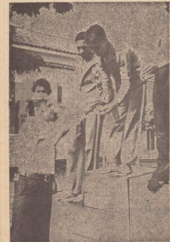
O vice-presidente da Camara Municipal, entregando o premio a um dos classificados.

Conforme publicação da Sociedade Esportiva Esquema, e re-feira dia 13, domingo último, 8 de maio, foi realizada a II Volta Universitaria, promovida