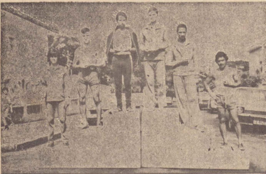
Os seis primeiros colocados no "Podium" após receber os premios a que fizeram jus, pela classificação obtida.

— Gosto demais do Guarani, porém sou profissional e preciso aproveitar essa chance. Além de tudo vou para o Cruzeiro, um dos maiores clubes brasileiros.