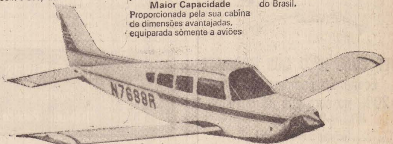
Com seis confortáveis assentos individuais, está à frente de qualquer outra aeronave de sua classe.

Tradicional qualidade e robustez Beechcraft A exemplo do seu irmão maior, o "SUPER R" incorpora todas as virtudes que tornaram o BEECHCRAFT "Bonanza" o monotor mais cobiçado do Brasil.