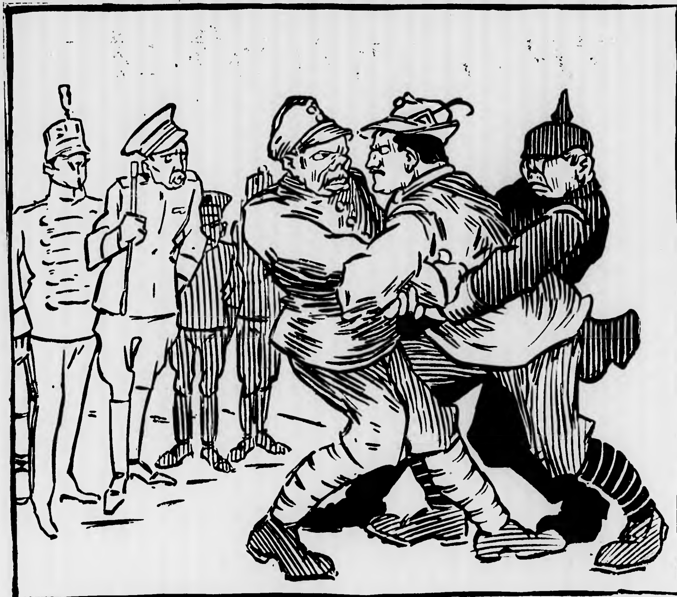
GLI ALLEATI: La stretta è terribile, ma con la sua forza e col suo valore, riuscirà a liberarsene!

delle sue idealità patriottiche, non è men vero che la sua azione ha salvato gli alleati.