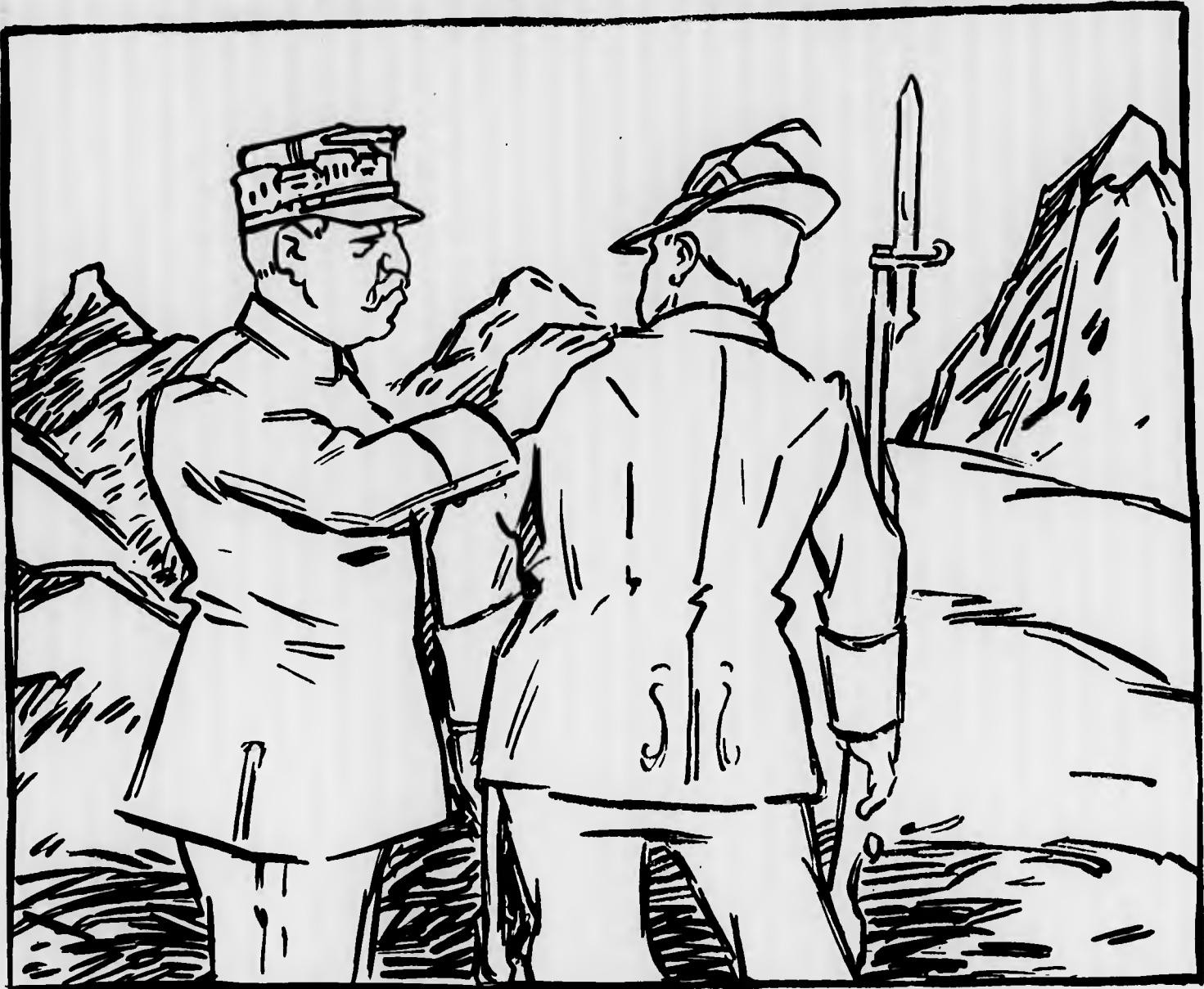
CADORNA : «Vinceremo!»