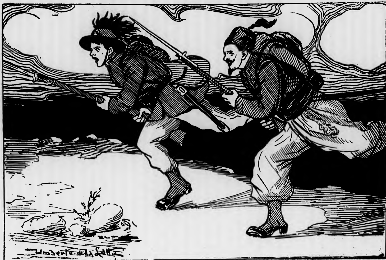
Come a San Martino ed a Solferino

ogni sforzo di resistenza è divenuto materialmente ed umanamente impossibile.