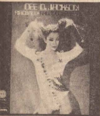
O "FIREBALL" DE DEE D. JACKSON