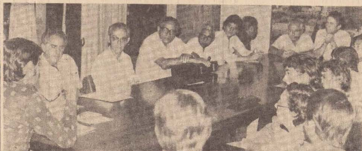
Um aspecto da reunião no gabinete do prefeito

O Frigorífico Prudentino acabou de ser transacionado com um grupo da Suíça que, segundo informações extra-oficiais, representaria os interesses do Estado do Vaticano.