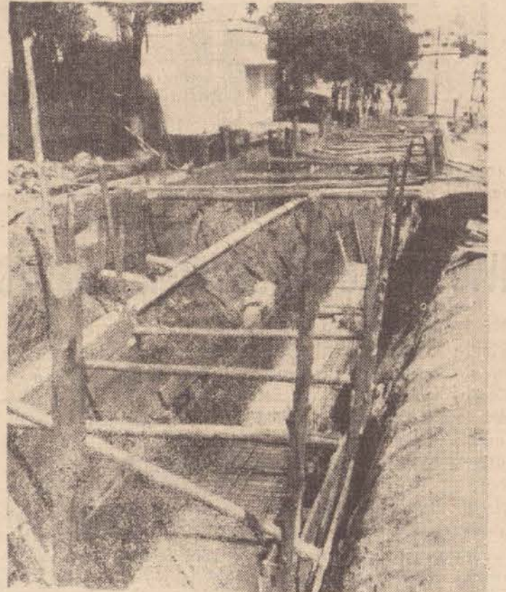
Segundo engenheiros da Prudencê que supervisionam os lotes A e B do Projeto Cura, dentro dos próximos sessenta dias estará concluída a galeria da rua Oleno Cunha Vieira.