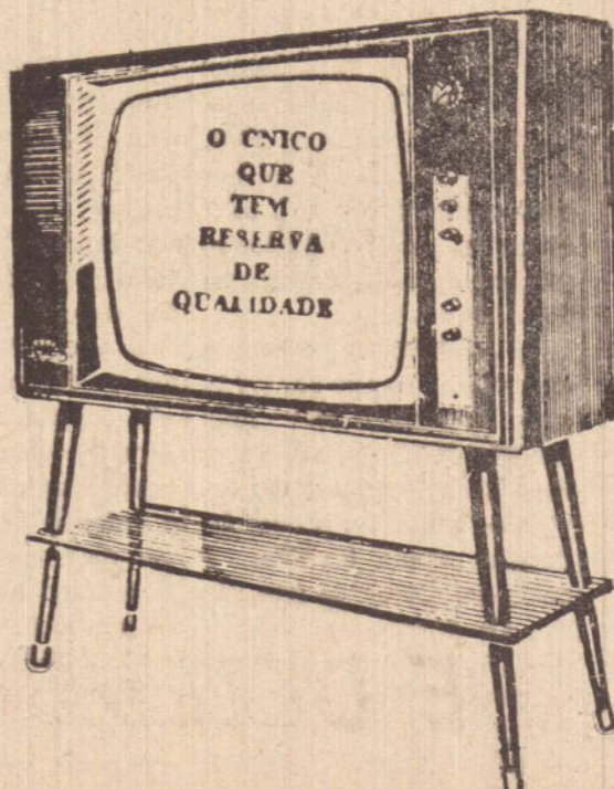
Imagem e som de presença total, com Reserva de Qualidade.