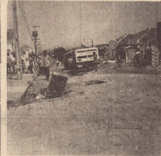
O caminhão não encontrou placa impedindo e seguiu caminho; resultado: apelo aos bombeiros.

Domingo último, pela manhã, os próprios moradores da rua Francisco Goulart, entre a Siqueira Campos e a Felício Tara-