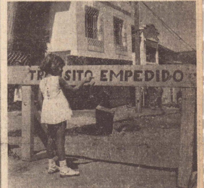
Depois do mal feito, coloca-se a placa. Até uma criança reconhece o erro que a administração não percebe...

vez por outra, um carro desavisado desliza para os buracos e se torna atração da vizinhança.