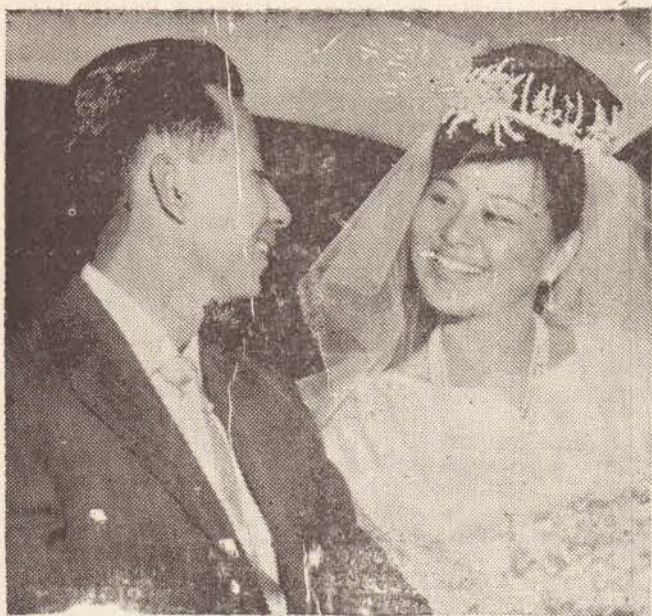
"Benzinho... hoje é dia de FEIRA. Arruma 10 mil cruzeiros, ouviu...?"