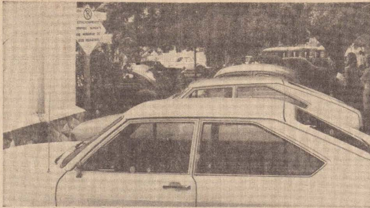
O automóvel continua roubando os espaços nas praças públicas destinados aos pedestres.