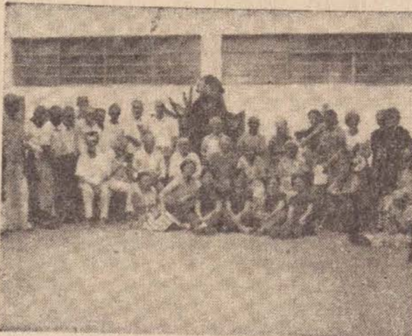
Na foto, os velhinhos, no dia do Anicião, com as domadoras