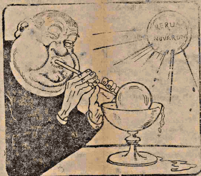
"Rerum novarum" é a tal intrujice de Leão XIII com que a padralhada pretende imbar os trabalhadores inconcientes. De nada valerá, porém, essa seráfica bolha de sabão para deter os oprimidos em suas justas reivindicações.

Como sucursal do balcão da igreja, montou um bar, onde, mais catolicamente, vende pinga e sorvete! Até quando se tolera tal sujeito? UM LANTERNEIRO.