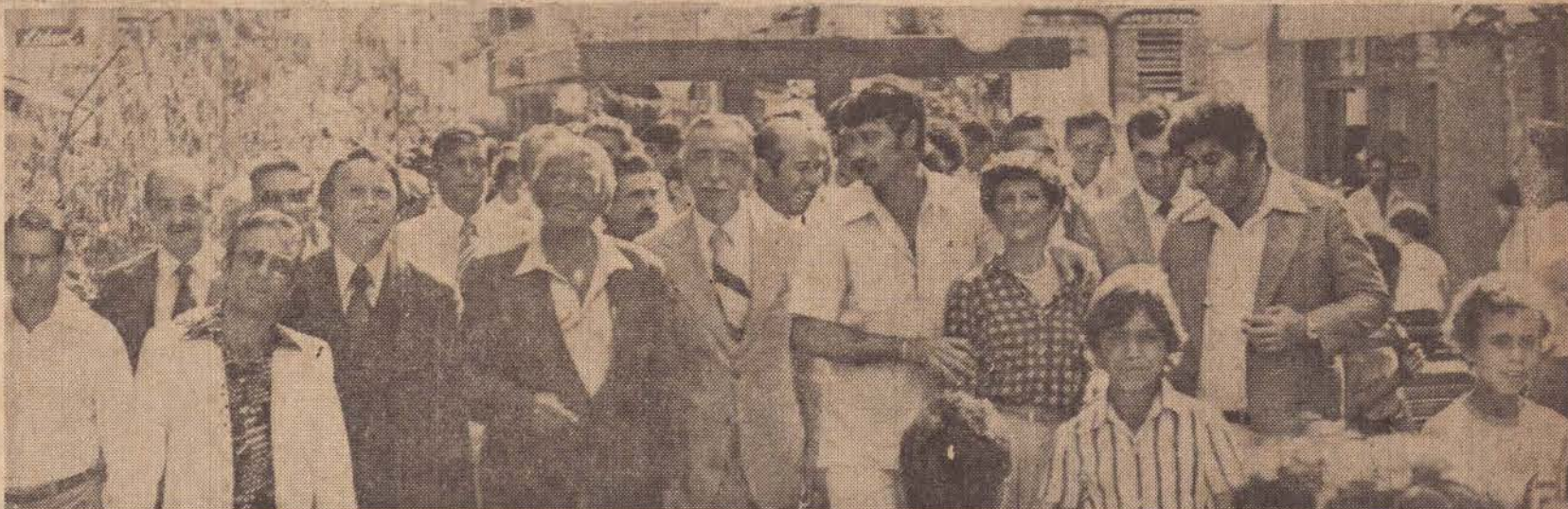
Na visita ao calçadão, o Ministro do Interior disse que os recursos do 1.º Cura, "foram muito bem aplicados em P. Prudente"