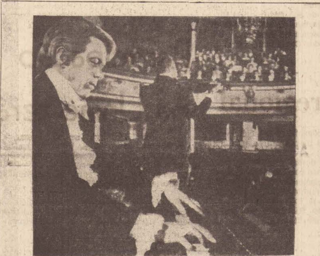
Canção do sol da meia noite EM CARTAZ NO CINERAMA

Alunos do Colégio "Tanel Abbud", 4as séries F e G (curso noturno) promoveram terça-feira o tradicional trote da escola, desfilando pelas ruas da cidade e banho no espelho d'água do Paço Municipal. Visitaram também a redação deste jornal onde foi feita esta fotografia.