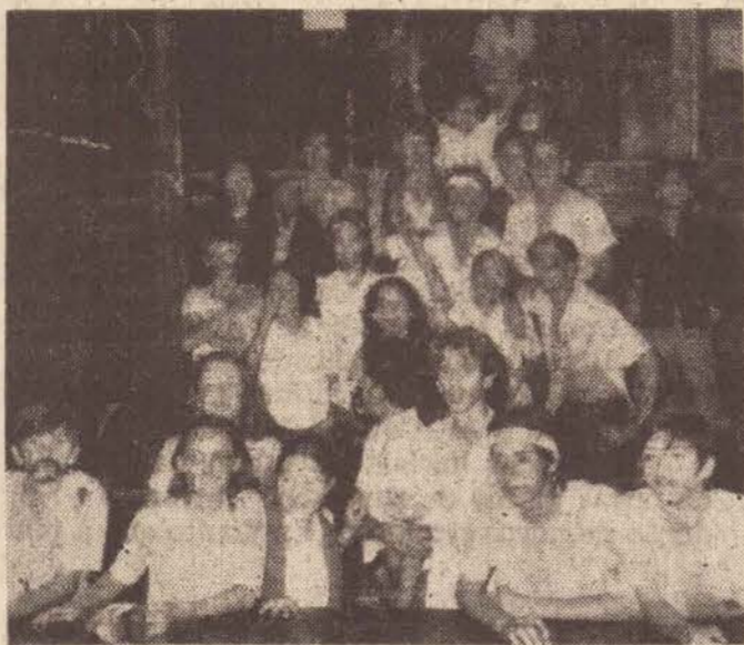
Alunos do Tanel fazem o trote

A Portaria aprova, também, os temas básicos do programa, divididos em duas fases e cria grupos de trabalho incumbidos de desenvolvê-lo. Para a primeira fase, os temas serão: Orçamento-Programa, Execução Orçamentária, Elementos de Cadastro, Tributação, Técnica de Arrecadação e Fiscalização. Na segunda fase: Contabilidade Pública, Planejamento e Reforma Administrativa.