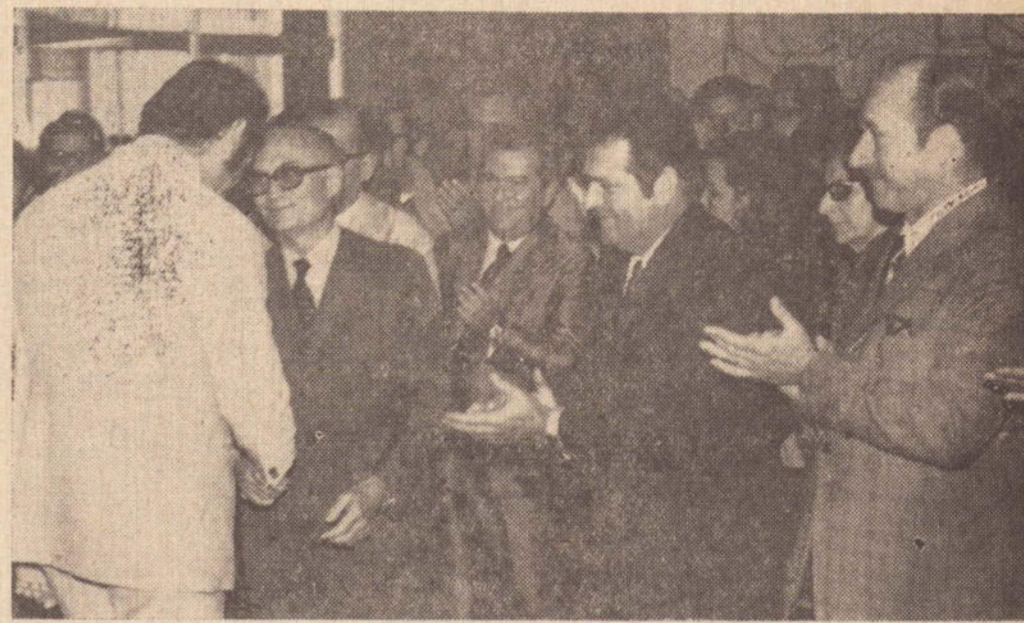
O prefeito Walter Lemes Soares, cumprimenta e agradece.