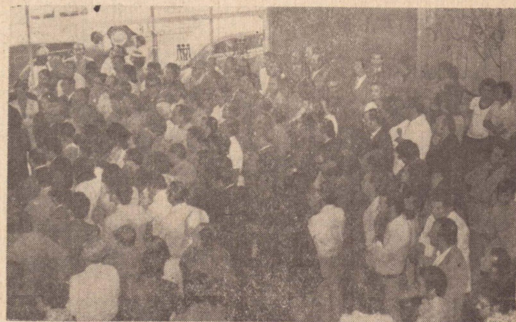
A solenidade inaugural das novas instalações do Banco Financiam de Mato Grosso S.A. reuniu muita gente.

novas instalações, como uma homenagem muito expressiva que se presta a nossa terra.