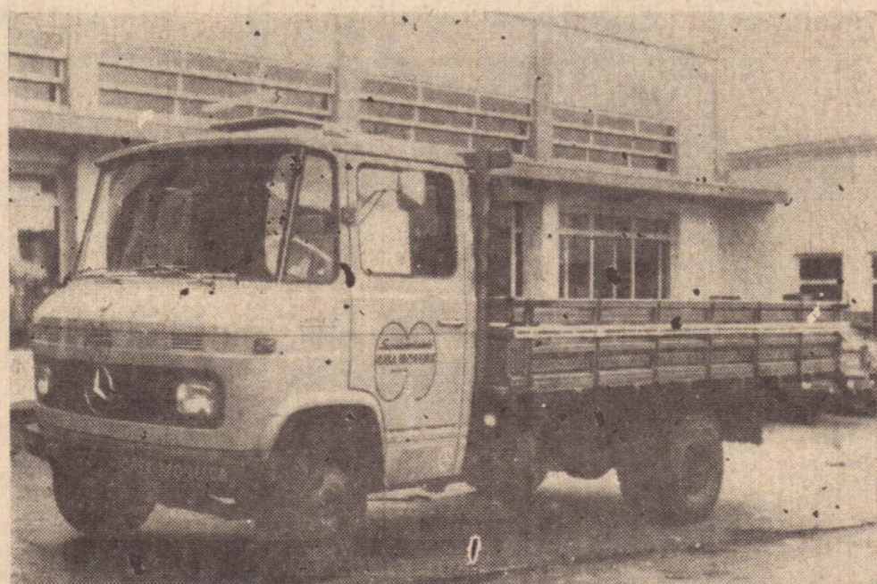
L-608 D — (MERCEDINHO) — Mais um produto da MERCEDES — BENZ DO BRASIL S.A.