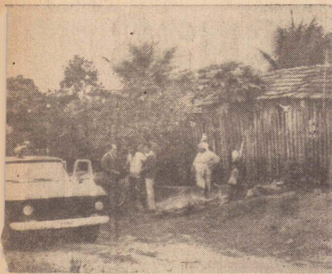
Vários "mocós" foram estourados pelos investigadores.