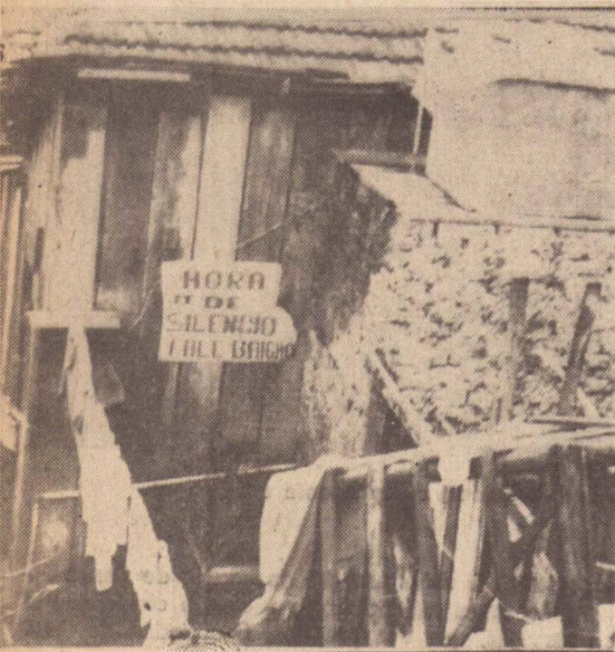
A placa pede silêncio, mas é disfarce usado pela locadora.

— Texto e fotos: — — Valderi dos Santos —